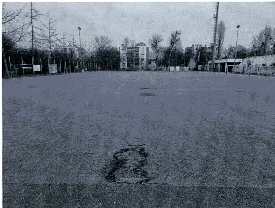
A Budai II László Stadion – műfüves edzőpálya jelenlegi állapota: