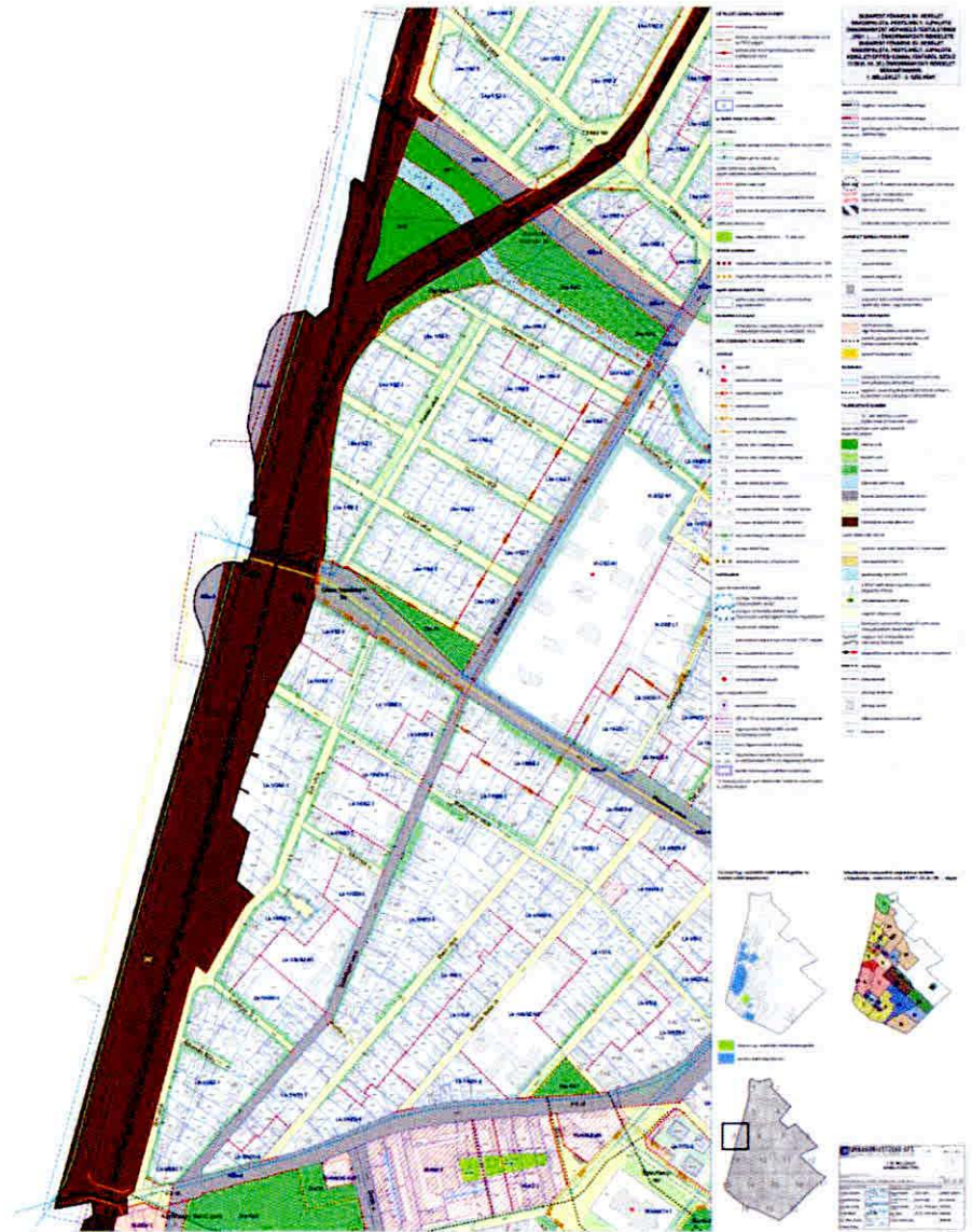
[ 5. sorszámú térképszelvény ]

Az R. 1. melléklet 5. és 9. sorszámú térképszelvénye helyébe a következő térképszelvények lépnek: