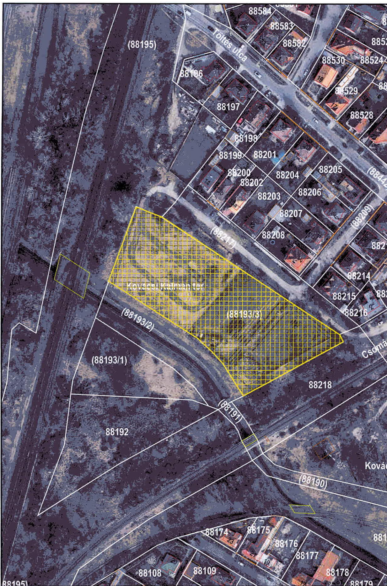
Budapest XV. kerület Kovácsi Kálmán tér közterület használata