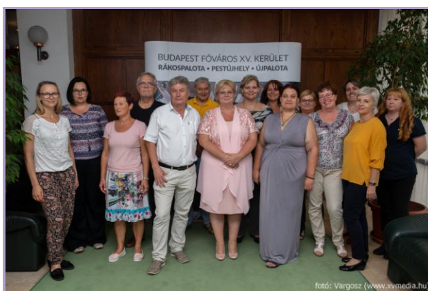
A budapesti nemzetközi projekttalálkozó résztvevői, 2019. augusztus 26.

A PROAGE projekt harmadik nemzetközi találkozója Budapesten zajlott a XV. kerületi partnerünknel, 2019. augusztus 26-27-én. A projekt résztvevői beszámoltak az egyes partnereknél zajló szellemi termék készítés helyzetéről, a jelenleg folyó munkákról.