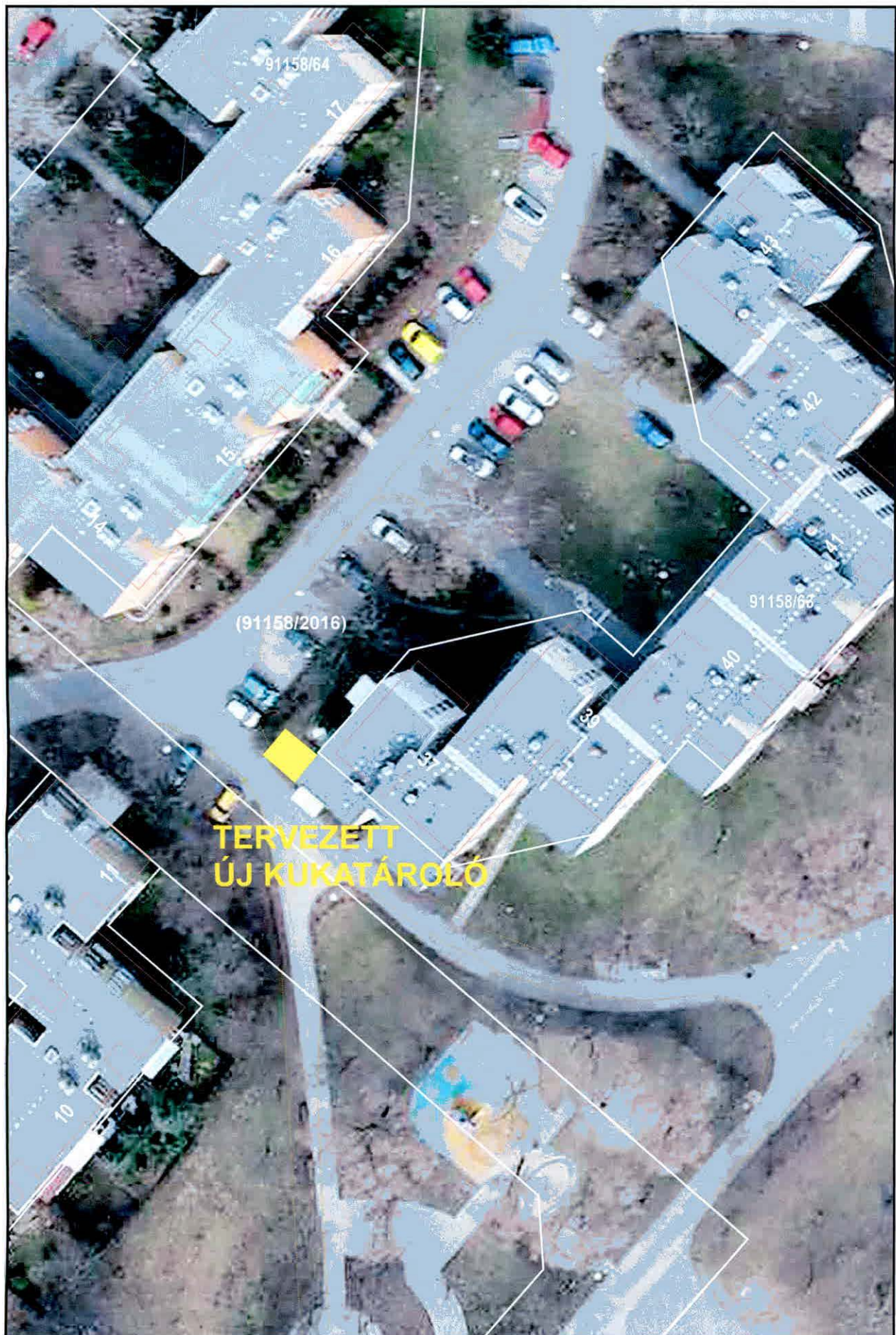
Körakás park 37. - Új kukatároló telepítése