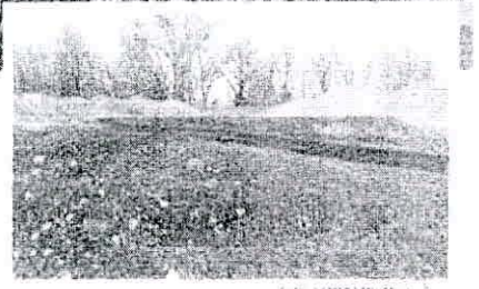
Fotó: A SZÉSZÉLY-FÉNY

helyként, szánkódombként vettek... használatba, amit nem vett jó né... ven a hónapok, lévén ott gyakor... latoznak tűzserzésre.