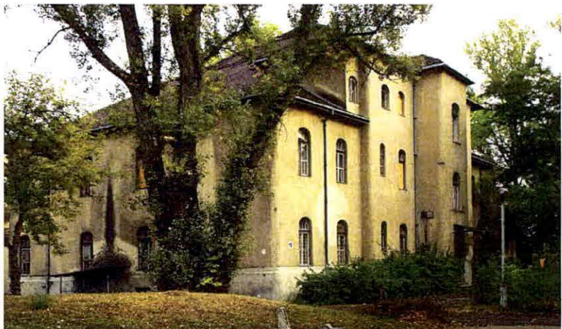
16 jelű épület saroktornya – a szecessziós homlokzatdíszek helyreállíthatók