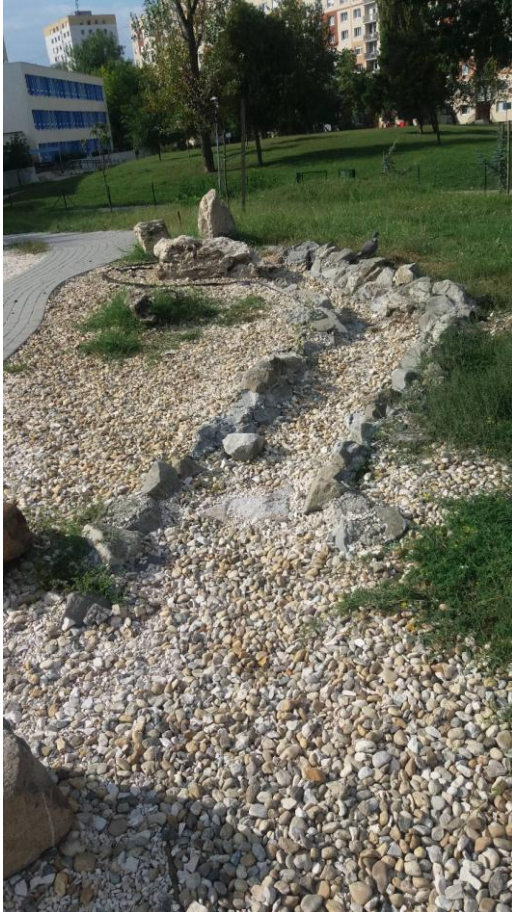
(2016. szeptember 20. A csobogó évek óta nem üzemel, halott, gazos, pusztuló kötenger benyomását kelti a terület.)