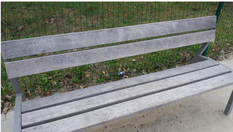
(2016. október 07. A padok állapota.)