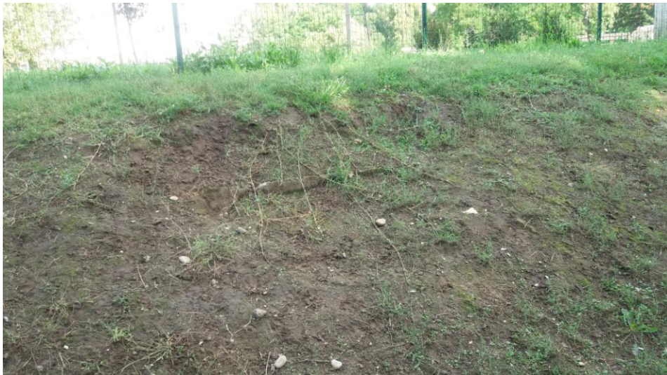
(2016. szeptember 20. A kert partfala, melyből kikandikál a korábbi beton támaszték.)