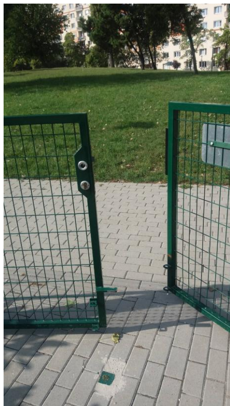
(2016. szeptember 20. A kapu a mai napig nem rendelkezik sem leszűrő pálcával, sem kilincsel, tehát a kert nem „zárható”.)