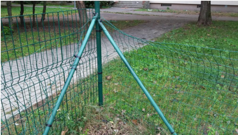
(2016. október 07. A kerítés állapota.)