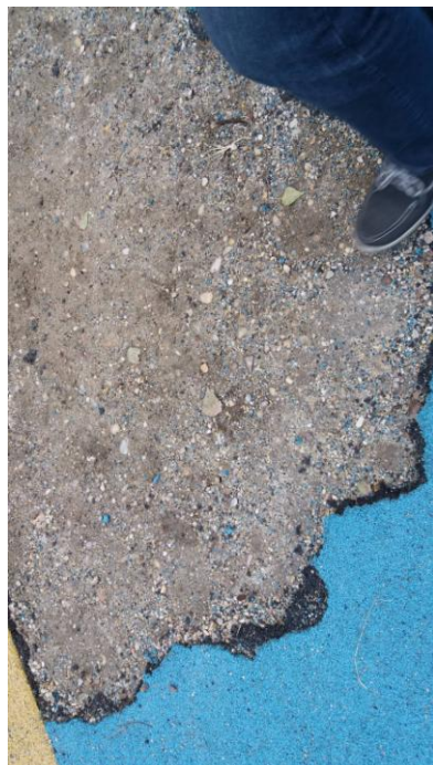
(2016. október 07. Az állapotok csak romlottak mind a rekortán, mind a kosárháló vonatkozásában.)