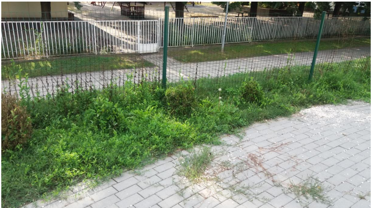
(2016.szeptember 20. A gaz mindenhol jelen van.)