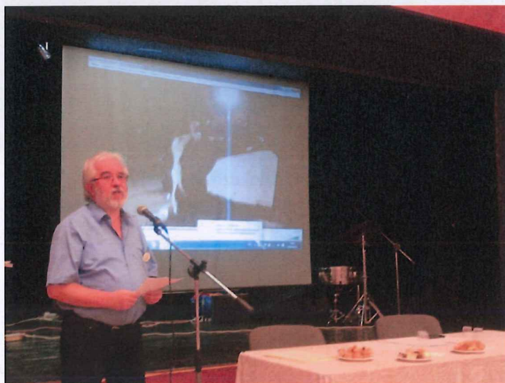
Visszaemlékezések, mindenki mellkasán az évfordulós kitűzővel.