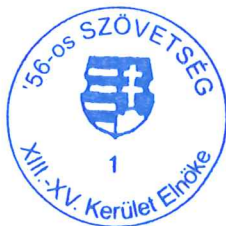
Bácskai Endre '56-os Szövetség XV. ker. elnöke