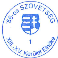
Bácskai Endre '56-os Szövetség XV. ker. elnöke