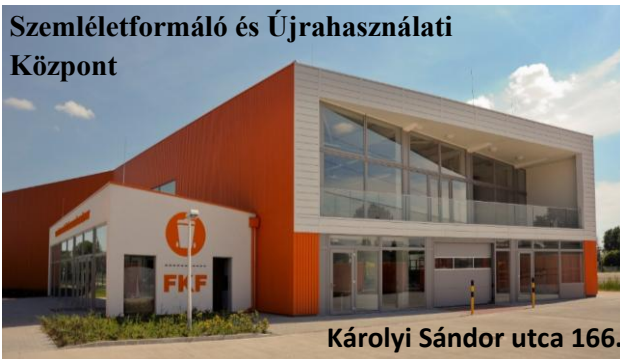
Károlyi Sándor utca 166.