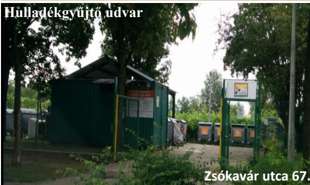
Zsókovári utca 67.