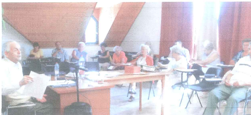
Lelki Oázis hét Kismaros, 2015

Istenünk kegyelméből terveinknek megfelelően rendben megtartottuk a IX. Lelki Oázis hetünket Kismaroson, a Pestújhelyi Református Egyházunk szervezésében, 2015. július 13 – július 17.-ig melyen 46 fő vett részt. Az ország legtávolabbi pontjairól (pl: Vásárosnamény), több száz km-t utazva is érkeztek közénk. Istennek adunk hálát, hogy ideális körülményeket biztosított számunkra. Istenünk szent Igéjének tükrében lehetőségünk volt átgondolni életünket, és mindannyian lelkileg megerősödvé térhettünk haza. Elmondhatjuk, hogy végig nagy érdeklődés mellett zajlott a programunk. Külön öröm volt számunkra, hogy sikerült széles körben megszólítani elsősorban a pestújhelyieket, gyülekezetünk tagjait.