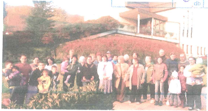
Gyülekezeti családi hétvége Kismaros, 2015. okt.31.

a Budapest Főváros XV. Kerület Rákospalota, Pestújhely, Újpalota Önkormányzata által támogatott Kismarosi Lelki Oázis hétvégéről