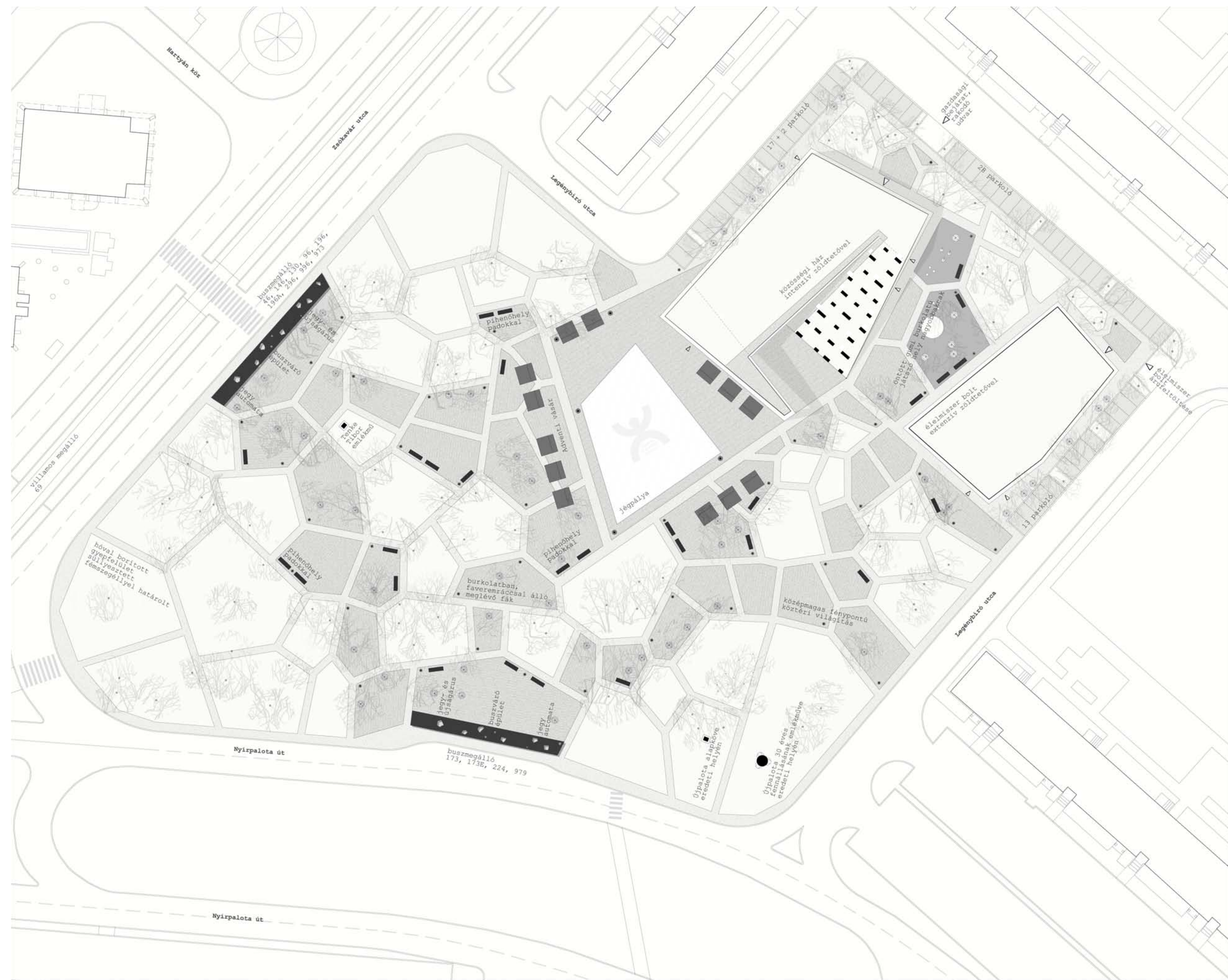
ősz-téli évad bemutatása