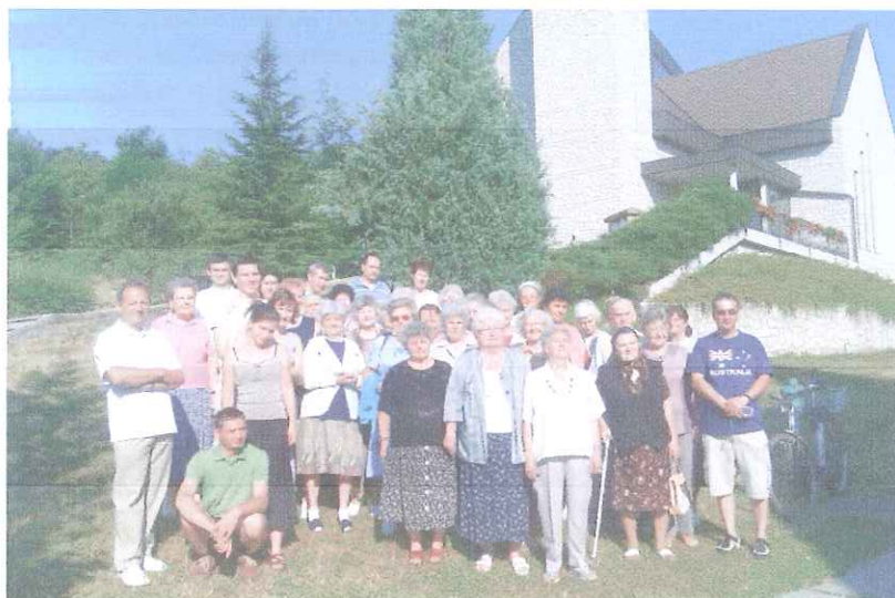
Kismarososi hét résztvevői