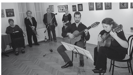
A „Tűzvirág 2014” kiállítás megnyitója.

sokszínű, színvonalas kiállítását Gyulai Líviusz grafikusművész nyitotta meg. És ezzel nem volt vége a zománcozásnak. Szintén a kerületi rendezvénysorozat égisze alatt zománcos hétvégét szerveztünk azoknak, akik domborított és rekeszománcos ékszerek témakörben kívánták továbbfejleszteni tudásukat. Aki lemaradt, a Tűzvirág 2014 című kiállítást december 18-ig megnézheti a Külvárosi Szalonban.