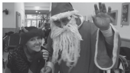
Pestújhelyre is megérkezett a Mikulás