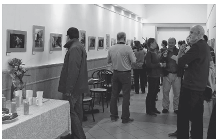
Az „Egytől-egyig” fotókiállítás megnyitója

Ha biztosra sikert akarunk bezsebelni, kiállítást rendezünk a Tűzvirág Tűzománc Alkotókör tagjainak. Ez most is bejött. Szendrei Judit tanítványainak