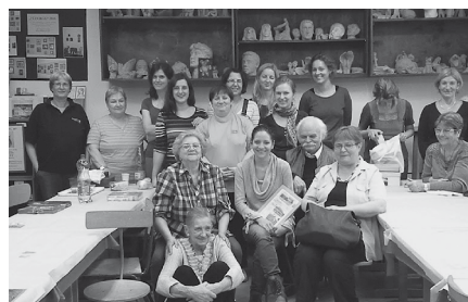
A „zománcos hétvége” résztvevői

A látogatókat a szünetben minden alkalommal adventi csemegével vendégel-