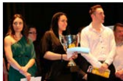
A Dunakanyar Hangja győztese