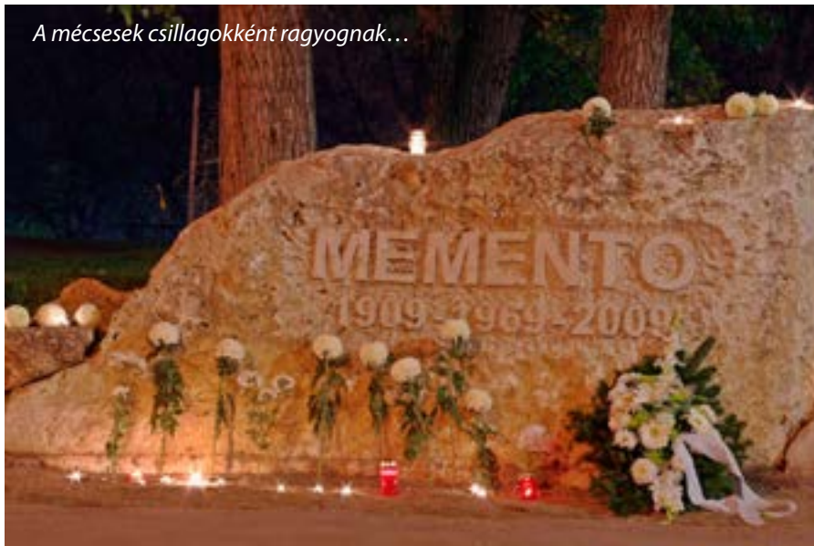
A mécsesek csillagokként ragyognak...

A külső kép: a hervadásé, a halálé és a menekülésé. Egyedül az ember függeszti szemét a mindenség lankadatlanul működő csillagaira, a távoli és nagy egészre, s azon is túlra...”