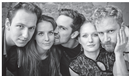
Koma - Társulat