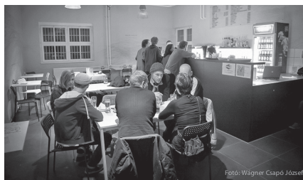
Koma Bázis – KáBé büfé