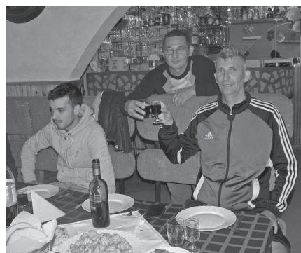
Baráti koccintás a Hörpentőben

Pestújhely-Hódos labdarúgó mérkőzés a Testvériség műfüves pályáján, melyen hazai siker született.