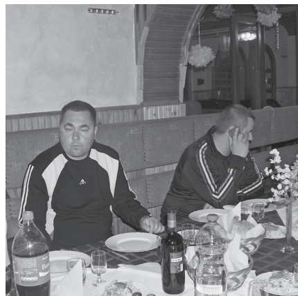
Közös vacsora a Hörpentőben