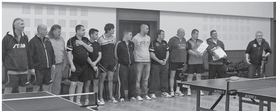
A dunaszerdahelyi vendégcsapat