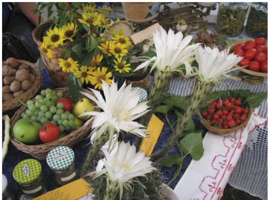
A kaktusz virága – szerencsés véletlen, a legjobbkor nyílt a ritka látványosság.