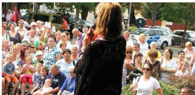
Keresztes Ildikó koncertjére egész tömeg gyűlt - még oldalt is sokan álltak.