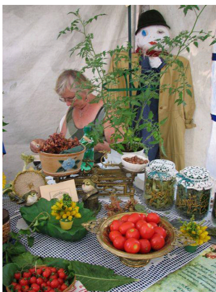
A madáritatóba állított sárga-zöld kis cserepes dekoráció a helyszínen, a kézműves foglalkozáson készült.