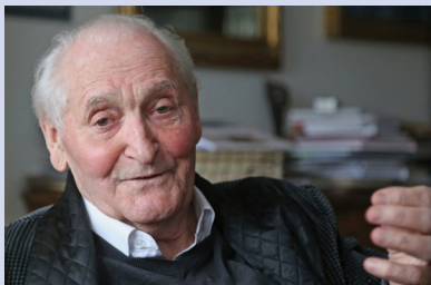
Kányádi Sándor: Csendes pohárköszöntő újév reggelén

A Sztárai Mihály tér rendezésének kérdése hosszú évek óta várat magára. Néha előtérbe kerül, majd sürgősebb gondok és feladatok háttérbe szorítják, s egy időre ismét lekerül az Önkormányzat napirendjéről. Ügyében a minap - 2013. január 3-án - a Képviselő-testület 1038/2012. (XI. 28.) sz. határozata alapján a Pestújhelyi Iskolában lakossági fórumot rendeztek.