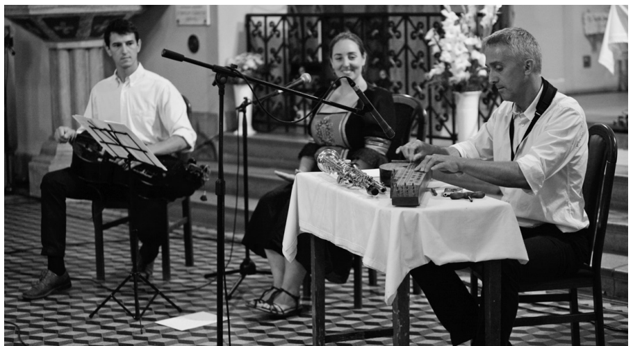
Augusztus 20. - Szól a muzsika

A megemlékezés után a Tallabille zenekar tagjai adtak koncertet. A pestújhe-