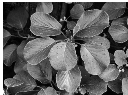
Kivi bokor (Actinidia chinensis)

Edzett, a városi klímát jól tűri. Tapadó fajtája, a veitchii tapadókorongokkal sima felületekre 10–15 m magasra is felkúszik. Épületek, kerítések falának befuttatására alkalmas. Háromkaréjú levelei fényes zöldek, igen látványos ősszel is, amikor levelei élénk vörösre színeződnek.