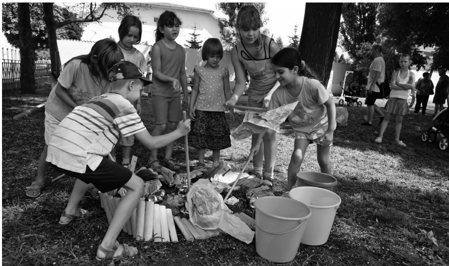
„Páratlan Vakáció” – öko-játszóház az Emlék téren

A Pestújhelyi Községi Ház „Páratlan vakáció” programsorozatának keretében, az ÖTHÉT egyesület szervezésében, július 31-én délelőtt játékos környezetvédelmi vetélkedőt rendeztek. Helyszínül az Emlék tér szolgált.