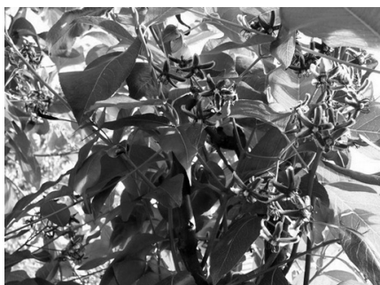
Görögtekerics (Periploca Graeca)

Gyors növekedésű, légygöckerei segítségével akár 10 méter magasra is felkapaszkodó cserje. Nyáron fürtökben megjelenő gyönyörű színű nagy tölcseres virágaiért ültetjük. Sok gyökérsarjat nevel. Napos helyre ültessük, tél végén vágjuk vissza a vesszőket, hosszuk harmadára.