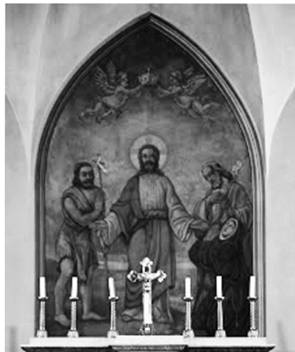
Az oltár mögötti freskó Bártki József alkotása.