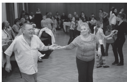
A táncmaratonon minden nemzedék képviseltette magát