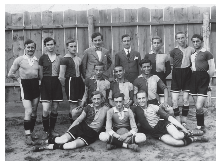
1935 körüli csapatkép