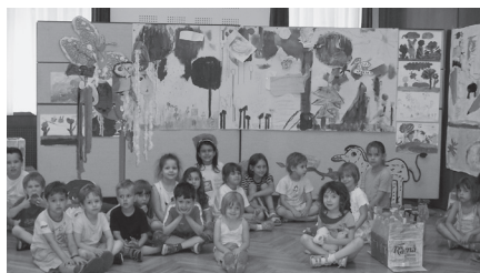
Az elmúlt évek egyik legnépszerűbb tábora a „Varázslatos” volt