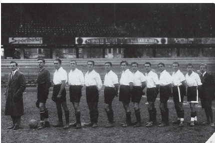
Kell egy csapat!