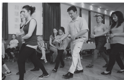
Az ír tánc ház nagyon tetszett a közönségnek