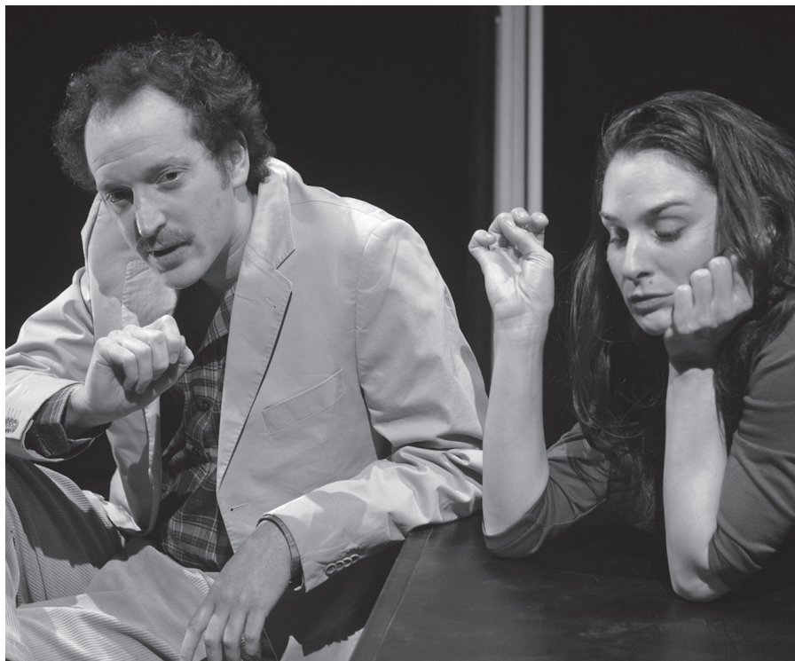
Áldja meg az Isten, Mr. Vonnegut”

(Szerkesztői megjegyzés: Az öt éve működő Koma Társulat 2011 tavaszán költözött kerületünkbe, a hajdani Petőfi Sándor Közgazdasági Szakközépiskola épületé-nek egyik szárnyába. Az elmúlt hetekben súlyos viharfelhők vetettek sötét árnyé-kot a Pestújhelyen épphogy gyökeret eresztett társulat jövőjére. Ugyanis komoly lehetőségként merült fel, hogy az Ady Endre utcai volt iskolaépületet - annak más irányú hasznosítása miatt - rövidesen el kell hagyniuk. Az, hogy a társulat med-dig dolgozhat még ott, továbbra is bizonytalan. Mindenesetre biztató jel, hogy a február 29-én lezajlott képviselő testületi ülésen úgy döntöttek, hogy a társulat továbbra is megkapja a kerulettől a pénzügyi támogatást, az Önkormányzattal kötött szerződésüket 2014. december 31-éig meghosszabbítják. Kívánjunk hát sok sikert a társulatnak és maradjunk továbbra is optimisták!)