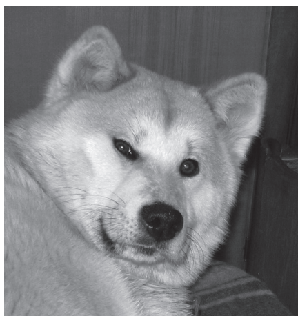
Aiko, a szerző ebe

A forróvíz gőzölög a kádban, mindjárt belelépek. Csak még... nyúlok a szokott helyre a polcon, s megdermedek. Nincs. Másol sem. Valami feldereng. Persze, akartam én már venni, kétszer is! De „törzshelyemen”, a Pestújhelyi téri családias kis boltban, ahol máskor is beszerezem, éppen nem kaptam a megszokott, bevált, évtizedek óta vásárolt márkát, aminek 600 Ft körüli ára is elfogadható. No, de akkor most mi legyen? Kutatok a fürdőszobai szekrényben – semmi. A szemem hirtelen megakad egy elegáns, fehér-piros ezüst flakonon. Hmm... végülis... nem is az, hogy... biztosan megfelel. Csak ne lenne olyan drága. Mondhatni, minden cseppjéért kár. Persze minőségi, francia gyártmány, szigorúan bio alapanyagokból. Szinte már tiszteletet érdemel. Az ára mindenképp: majd' 4.000 forint volt.