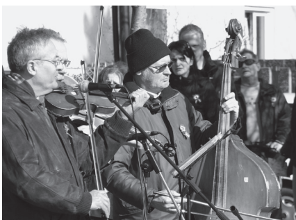
A Mező Együttes muzsikál