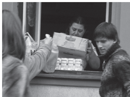
Megérkeztek az ajándékok