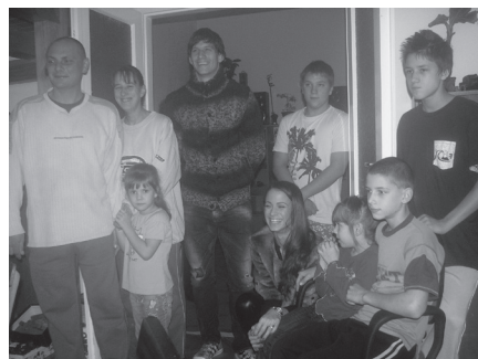
Vendégségben a Stiller családnál