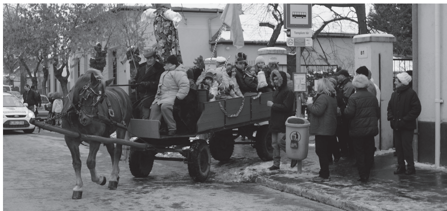
A múzeum udvaráról indul a farsangi menet