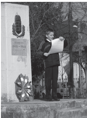
Az ifjúság hangja...