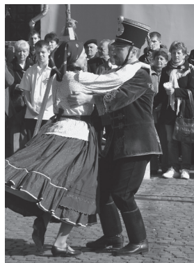
Táncosok a műsorban