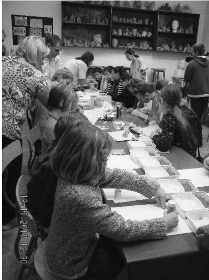
Kézműves foglalkozó a Kutyakötelesség klubban

szélgetés is. Kisebb, de nagyon okos felvetéseket termő vita bontakozott ki a tolerancia kérdéséről – középpontban természetesen az állatokkal. A téma apropója a Tolerancia Világnapja (november 16.) volt, a beszélgetők olyan kérdéseket boncolgattak, mint: létezik-e tolerancia az állatok világában, vagy milyen helyzetekben van szükség a tolerancia gyakorlására az állattartók – nem állattartók között.