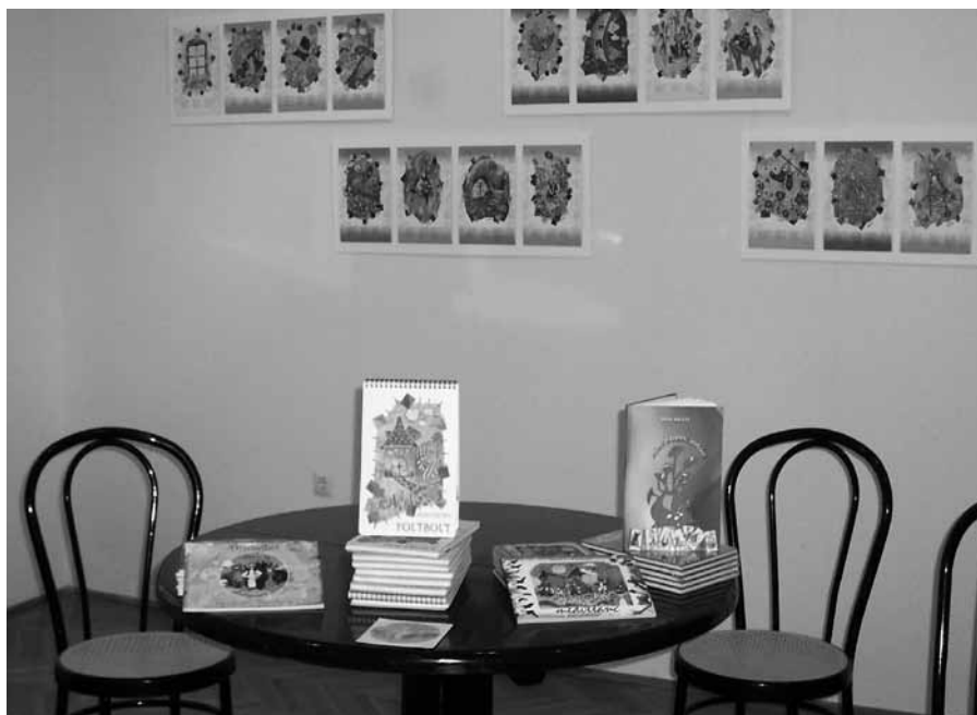
Dézsi Zoltán gyermekkönyvei