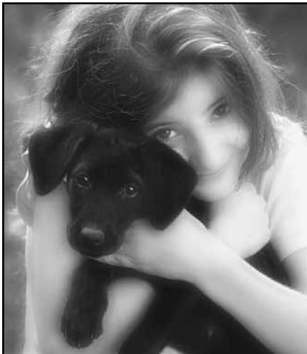
A második kategória nyertes fotója, Kiss Imre (Pécs): „Gyerekek”