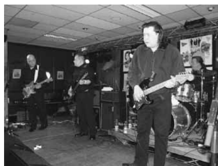
A Regents együttes