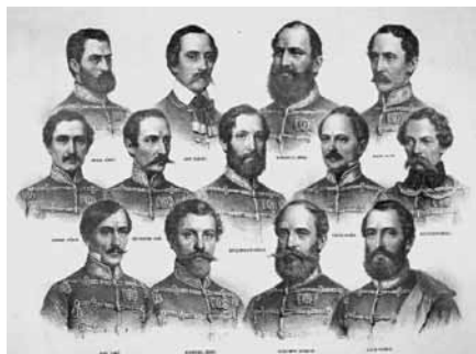
A 13 aradi vértanú