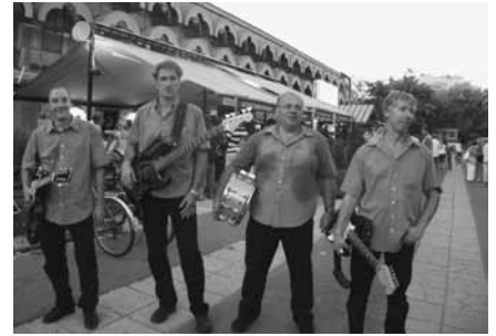
A Hundows együttes

A koncert előzenekara a Pestújhelyen már jól ismert Hundows együttes, amely 26 éve töretlenül népszerűsíti a gitárzenét hazánkban, és Európa más országaiban is, s éppen a napokban kapott svédországi meghívást! Közönségünknek nagyszerű zenei élményben lesz része! A korlátozott számú férőhelyek miatt érdemes a jegyet elővételben megvásárolni. Az elővételben megvásárolt jegyek ára 2500 Ft. A koncert napján, a helyszínen vásárolt jegyek ára 3000 Ft.