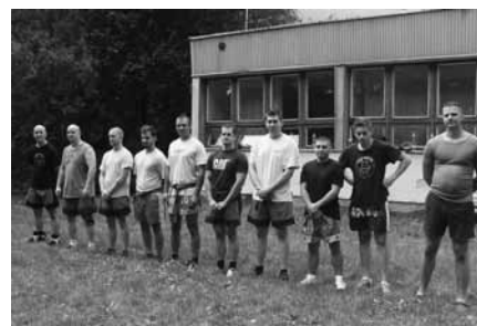
Thay Won Do sportolóink Tatán

A sportolók túlnyomó többségének a „mindenki hozzon egy embert” népszerűsítő játék tetszett a legjobban, melynek keretében a sportközösségünkbe nem tartozó táborozókat kellett „csatasorba állítani”.