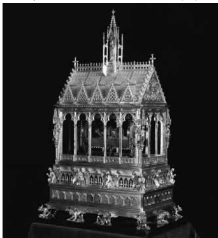
A Szent Jobbot őrző ereklyetartó

A Szent Istvánra való emlékezésnek ezeréves hagyománya van az egész Kárpát-medencében. Műve és öröksége e régió történelmének alapvető fontosságú része, a magyar történelmi köztudat megkerülhetetlen és kitörölhetetlen eleme. Államalapítónk tisztelete 1083. augusztus 20-án teljesedett ki, amikor Szent László királyunk VII. Gergely pápa hozzájárulásával szentté avattatta (bár az egyetemes egyház nevében csak 1686-ban nyilvánította szentté XI. Ince pápa)