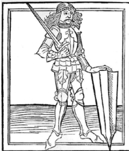
Hunyadi János a „törökverő” (Fametszet Thuróczy János krónikájának brünni kiadásában)

A déli harangszó az egész kereszties világban azóta is a nándorfehérvári diadalra emlékeztet. Illő hát, hogy mi is megemlékezzünk az 555 évvel ezelőtti eseményekről, és azokról a hősről, akik életük árán is helytálltak egy kilátástalan helyzetben, és valóságot formáltak a lehetetlenből! Lenne mit tanulnunk tőlük!