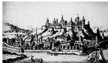
A Kárpát-medence és a Balkán-félsziget találkozásánál, a Duna és a Száva összefolyásánál fekvő Nándorfehérvár (Belgrád) 16. századi ábrázolása.

gondja nem is a török elleni háború szervezése, hanem a magyarok közötti ellentétek elsimítása volt. Az 1456 januárjára összehívott országgyűlés csak április elejére ült össze, és ott az a különös döntés született, hogy az országos had csak augusztus elejére jöjjön össze, mert meg kell várni az aratás végét. Holott ekkor már nyilvánvaló volt, hogy a szultán Nándorfehérvár ellen készül, és mikor valóban megérkezett a szultáni had megindulásának híre, az országgyűlés pánikszerűen feloszlott, azzal a határozattal, hogy a had vonuljon a déli