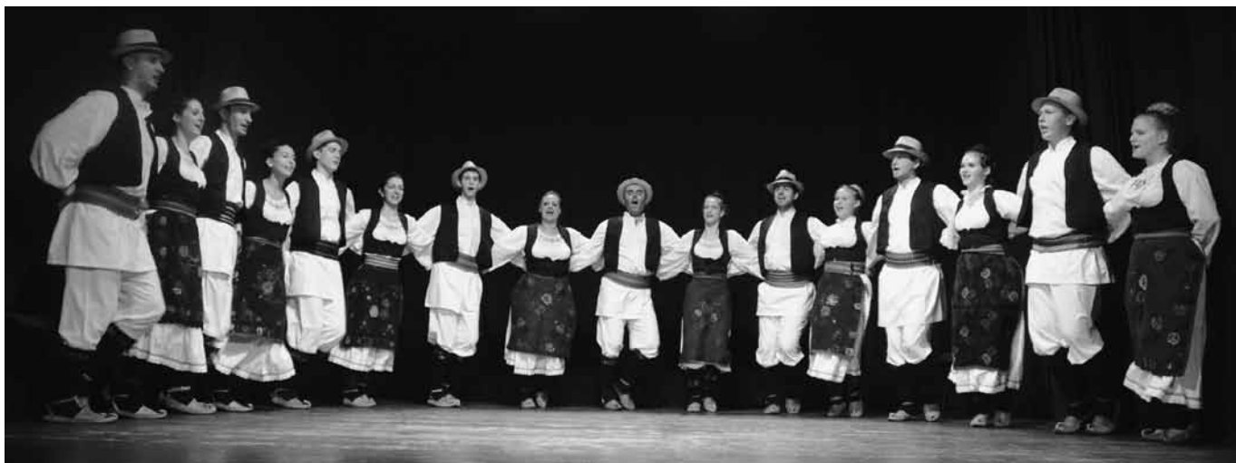
A Tabán Néptánc Együttes