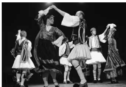
Az Iliosz táncegyüttes