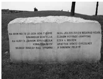
Szerb és magyar nyelvű emlékkő a csata helyén

Az 1456. július 22-én sikerrel megvívott csatát – tekintettel kivívásának körülményeire, hosszú távú következményeire, illetve nemzetközi jelentőségére – a hadtörténelem az egyik legjelentősebb magyar győzelemként tartja számon, amely közel hét évtizedre megállította a törökök európai terjeszkedését. De a győzelemért nagy árat kellett fizetni. A harcoknak és az ostrom idején kitorő járváynak sok ezer élet esett áldozatul, augusztus 11-én Hunyadi Jánost, október 23-án Kapisztrán Jánost is elragadta a pestis.