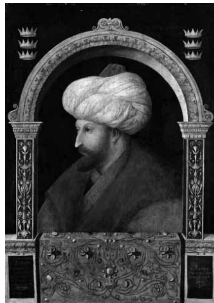
II. Mehmed a török krónikák szerint kétszáz várost és tizenkét országot csatolt birodalmához, és ezzel kiérdemelte a „hódító” melléknevet.

Magyarország a török támadás előtt az egymással versengő bárói csoportok széthúzása következtében nem állt készen a külső veszéllyel szembeni összefogásra. Az 1455-ös országgyűlés ugyan megerősítette Hunyadi Jánost országos főkapitányi tisztségében, de a főurak jelentős része túlzottan tartotta a főkapitány hatalmát és azt akár egy kulcsfontosságú végvár elvesztése árán is gyengíteni igyekezett. Így az 1455 szeptemberében Magyarországra érkezett Juan Carvajal pápai legátus legnagyobb