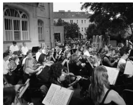
Koncert az Észak-pesti Kórház kertjében

Különleges csemegének bizonyult viszont, már csak a helyszín hangulata miatt is, az Észak-pesti Kórház kertjében, a gyönyörű, régi épületek közt, hatalmas öreg fák alatt megrendezett Strauss ajándék koncert. A MÁV Szimfonikusok tolmácsolásában felcsendülő dallamok az apró gyerekeket látványosan épp úgy elvarázsolták, mint fiatalokat, középkorúakat és idősebbeket. A zene szárnyán, egy kicsit visszarepülhettünk a múltba is.