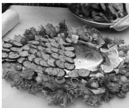
A győztes halkolbász