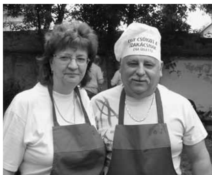
Főzőverseny; „Egy csókot a szakácsnak (ha ízlett)”