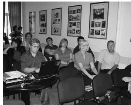
A „Civil napok” résztvevői

Kicsik, és nagyok egyaránt élvezhették a Bab társulat különleges óriásbábokkal bemutatott előadását. Az épületben pedig, közben – hogy a kártyajátékokat ne csak az ulti képviselje – tartott a „Négy kerület Kupa” bridzs bajnokság, és a Pestújhelyi Pátria Egyesület szervezésében a VI. Határtalan Civil Nap, felvidéki magyar egyesületek részvételével.