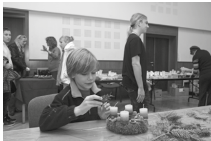
Ádventi koszorúkésztés a Községi Házban