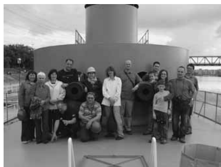
A lövegtorony előtt