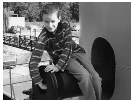
Van benn valami?