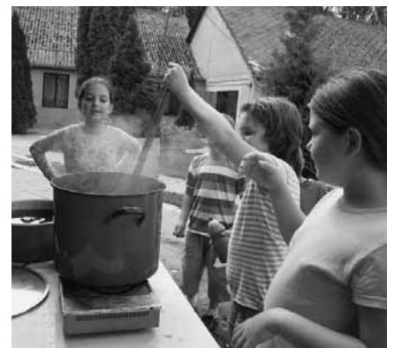
Pólófestés a napközis táborban