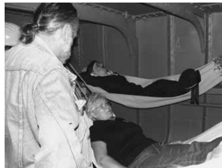
Pihenő a függőágyban

S most már ugyan önerejéből nem szeli többé a Duna hullámait, a lövegtornyá-