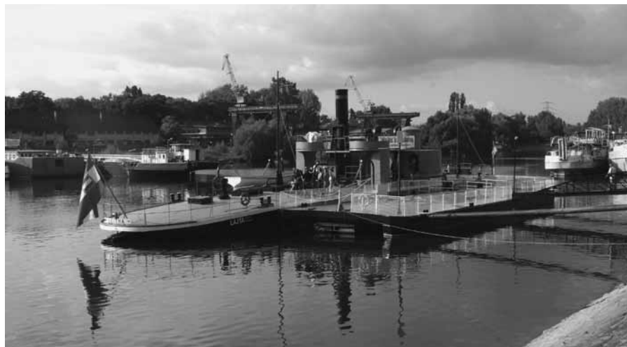
A Lajta monitor