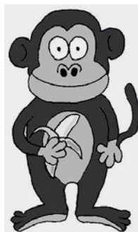
(Rajz: Bata Gábor)

Örül a majom a banánnak, De még jobban örül a farkának: Farok nélkül élni hogy lehet? Milyen furcsák az emberek!