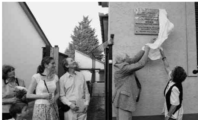
Dr. Lövey József emléktáblája