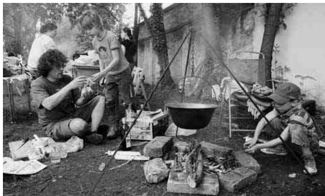
Készül a mexikói rizses hús

A rendezvénysorozat számos alkalmat kínált a verseny-szellem kibontakozásának is. A versengésben legeredményesebb résztvevők számos díjjal és megtisztelő címmel lettek gazdagabbak, az alábbiak szerint: