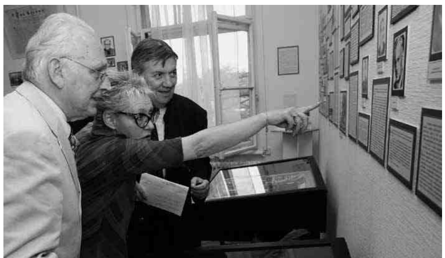
A „Gyógyítók” című helytörténeti kiállítás megnyitóján