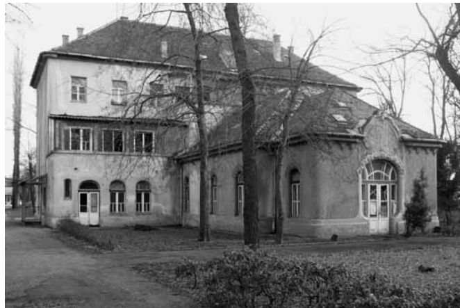
A kihasználatlan épületek egyike a pestújhelyi kórház területén

és a helyi lakosok is, de átfogó, hosszú távú eredményre nem jutott senki. Szeretnénk, ha Pestújhely terei, utcái, épületei nem csak pillanatnyi fellángolásból, vagy egy-egy választási kampány hatására változnának, hanem együtt gondolkodnánk arról, hogy hogyan is legyen az elkövetkezendő száz évben. Kiemelten foglalkoznánk a pestújhelyi kórház sorsával, a Pestújhelyi térrel, a Sztárai térrel, a Kolozsvár utcai piac sorsával.