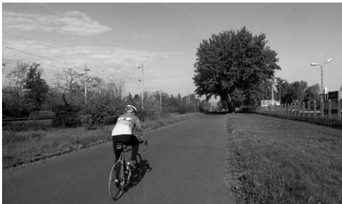
Kerékpár versenyző edz a Körvasút soron

Kiemelt fontosságúnak tartjuk a Körvasút sori körút megépítésének megakadályozását, a kerékpáros közlekedés infrastruktúrájának kiépítését, a parkolókat, az egyirányú utcák kiépítését, a forgalom- és sebességcsillapítókat, a biztonságos kereszteződések kialakítását.