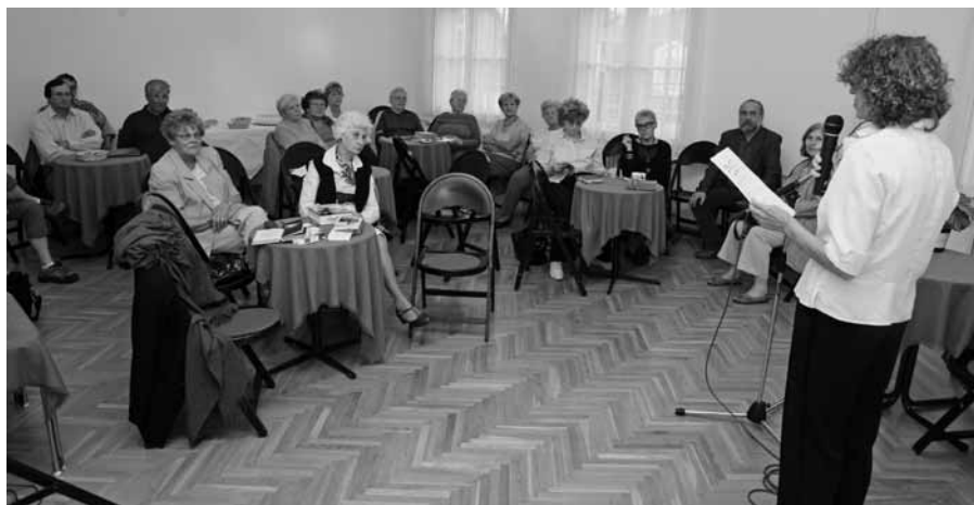
Versbarátok a Költészet Napján