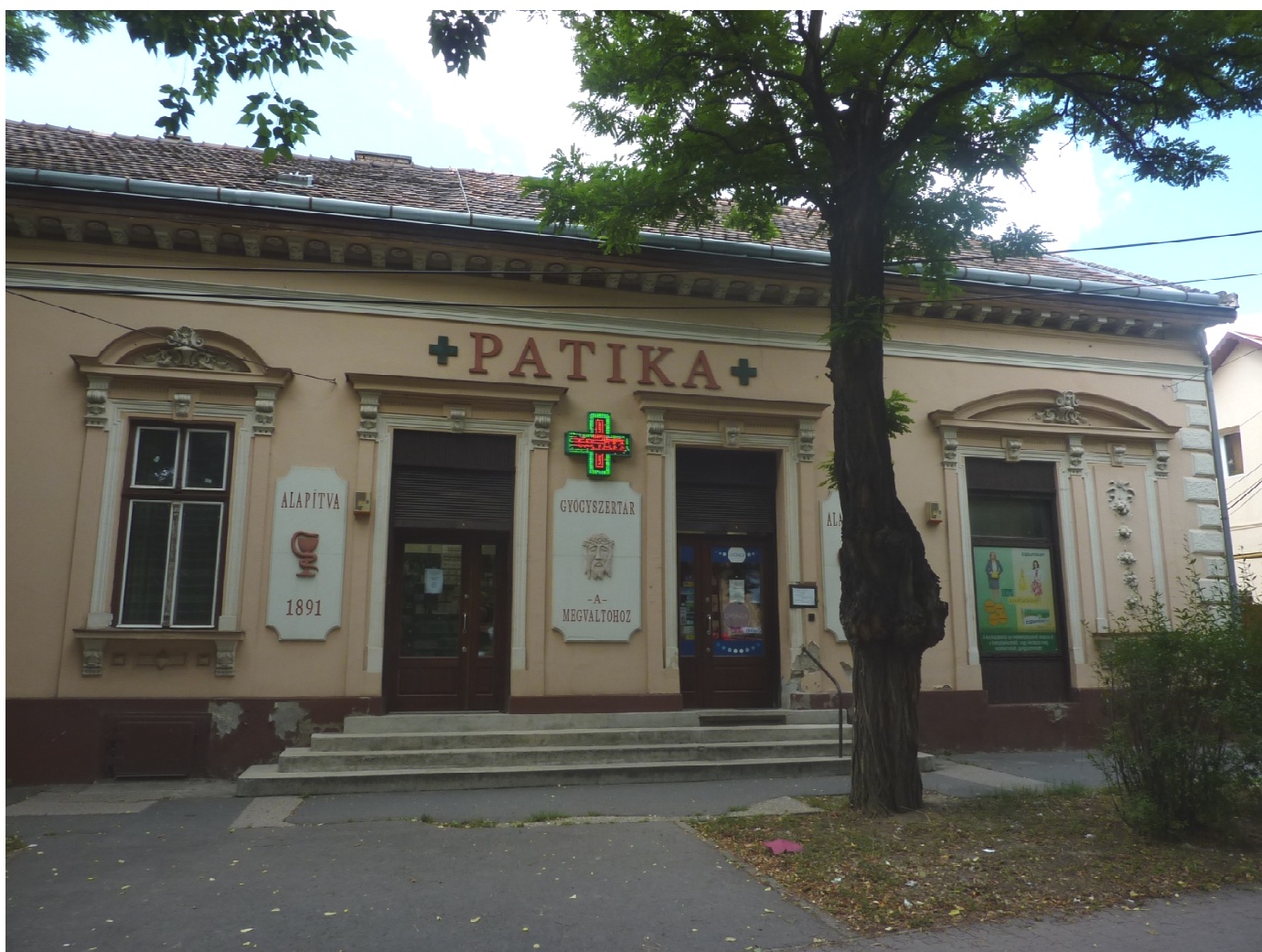
Fotó: Böröczi Belán, 2017