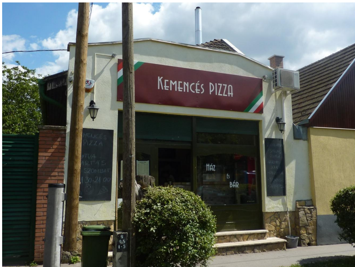
Fotó: Böröczi Belán, 2017