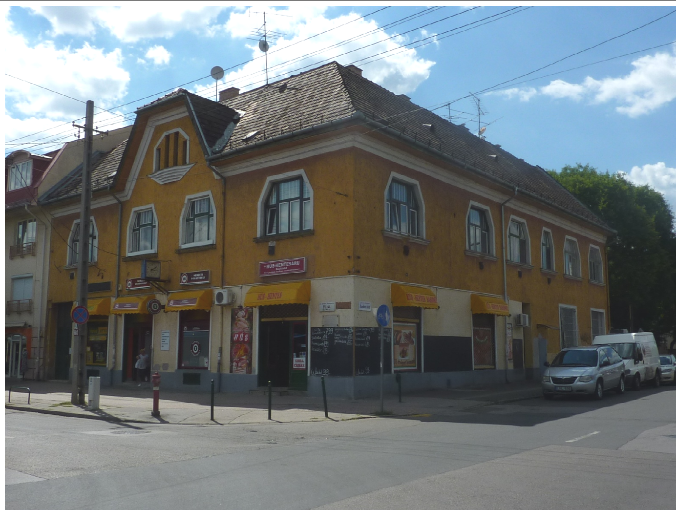
Fotó: Böröczi Belán, 2017