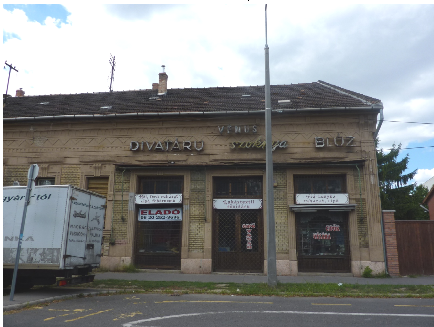
Fotó: Böröczi Belán, 2017