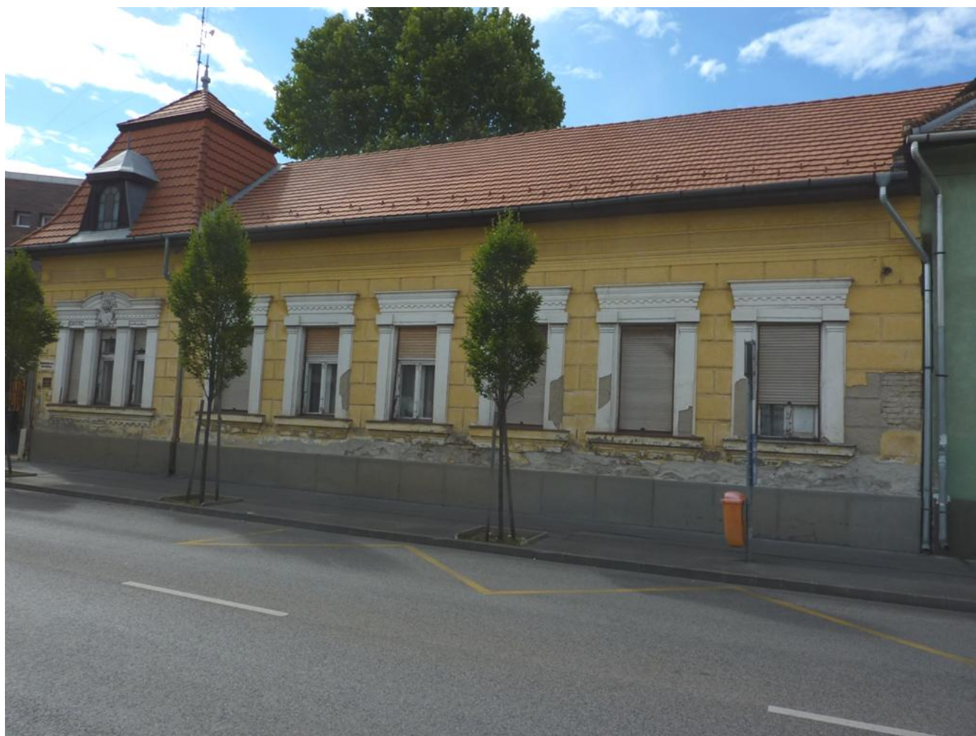
Fotó: Böröczi Belán, 2017