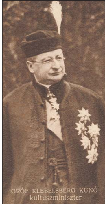
GRÓF KLEBELSBERG KUNÓ kultuszminister

A kortársak véleménye jellemezheti legjobban egy politikus alakját: így érdemes például felidézni, hogyan méltatta a Nobel-díjas Szentgyörgyi Albert professzor Klebelsberg Kunót: „Egyik legnagyobb meglepetése és benyomása volt életemnek láthatni,