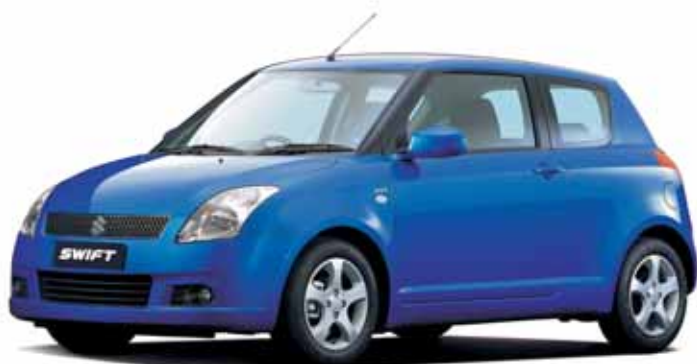
A kép illusztráció!