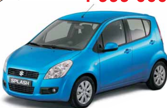
A kép illusztráció!