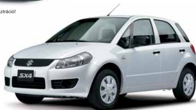
A kép illusztráció!

Fajlagos CO kibocsátás: 120-245g/km. Suzuki modellek átlagfogyasztása: 5-10,6l/100km. Az ajánlat nem teljeskörű, a részletekről érdeklődjön szalonunkban!