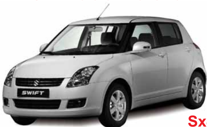
A kép illusztráció!