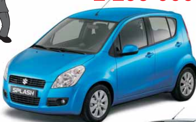
A kép illusztráció!