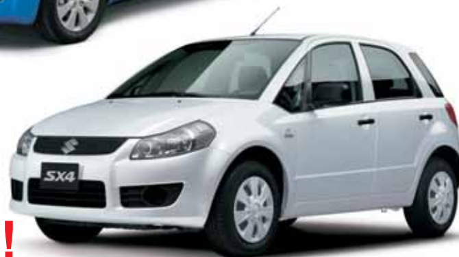
A kép illusztráció!

Fajlagos CO kibocsátás 120-245g/km. Suzuki modellek átlagfogyasztása: 5-10,6l/100km. Az ajánlat nem teljeskörű, a részletekről érdeklődjön szalonunkban!