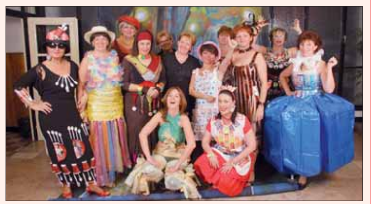
Báli szezon a kerületben. Képünk a Szüreti bálon, a Kolozsvári NOK-ban készült.

- 1998. óta nem jártam Rákospalotán. Úgy vélem, egy elődnek nem is etikus megzavarnia jelenlétével az utód munkáját. Ugyanakkor abban a szerencsés helyzetben vagyok, hogy Sándor atya korábban az én tanítványom volt, így a viszonyunk is jó. Ezért is vállaltam el ezt a felkérést, és meg kell mondanom, hogy jó érzéssel töltött el ez a néhány órai palotai tartózkodás. Magyarországra sokszor visszatérek, például Meszlényi Zoltán püspök boldoggá avatásán veszek részt.