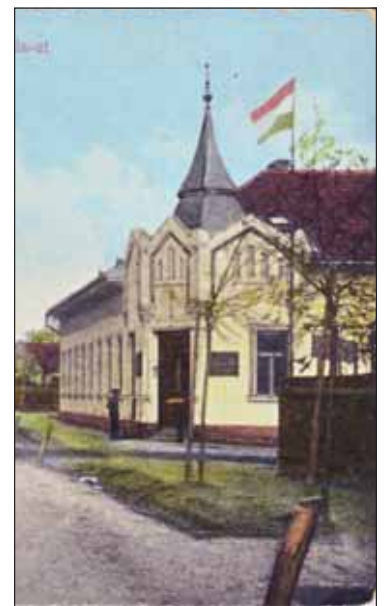
Az egykori Pestújhelyi Községháza épülete