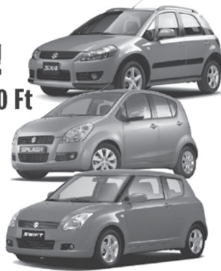
Az ajánlat nem teljes körű, a részleteket érdeklődésünkre szívesen megválaszoljuk!

Augusztus 1-jétől kizárólag a készlet erejéig! Az ajánlat más kedvezménnyel nem vonható össze!