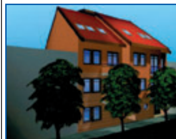
XV. Bethlen G. u. 24. szám alatt épülő 8 lakásos társasház