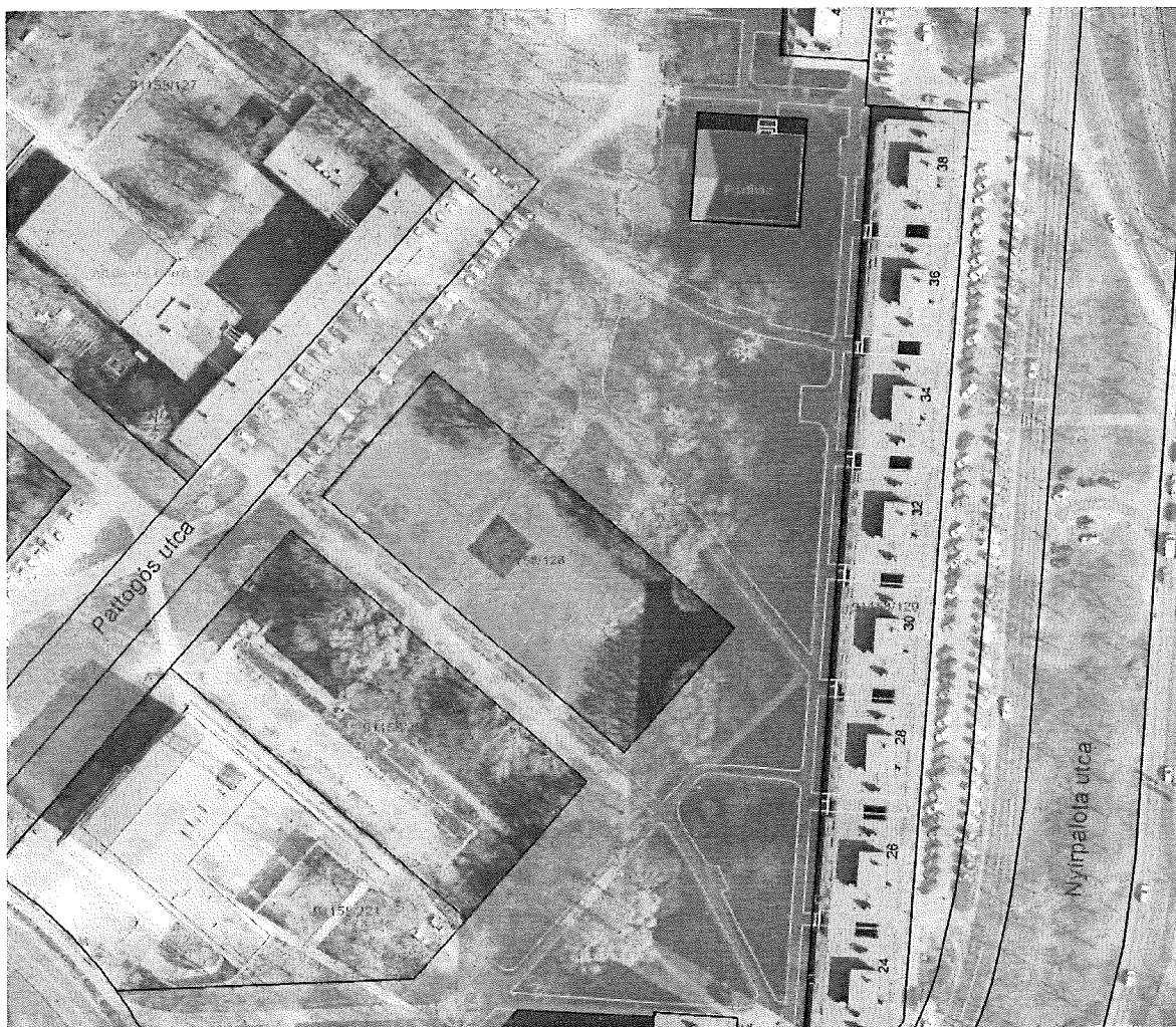
IKT helyszín - légifotó