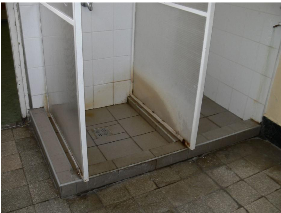
4. kép: zuhanyzó