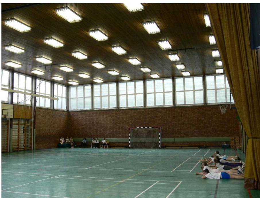
6. kép: tornaterem