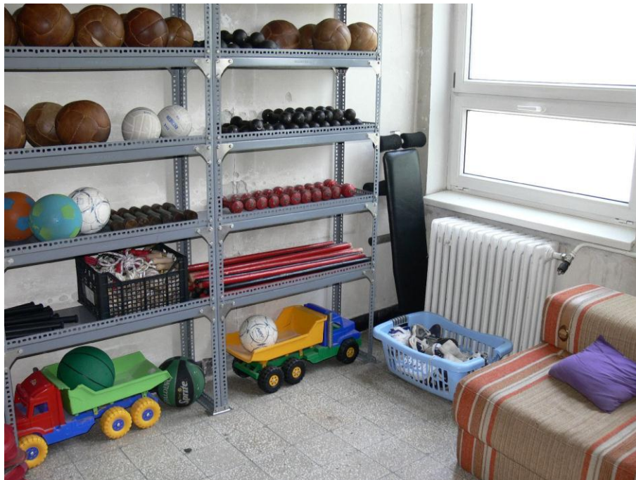
3. kép: szertár