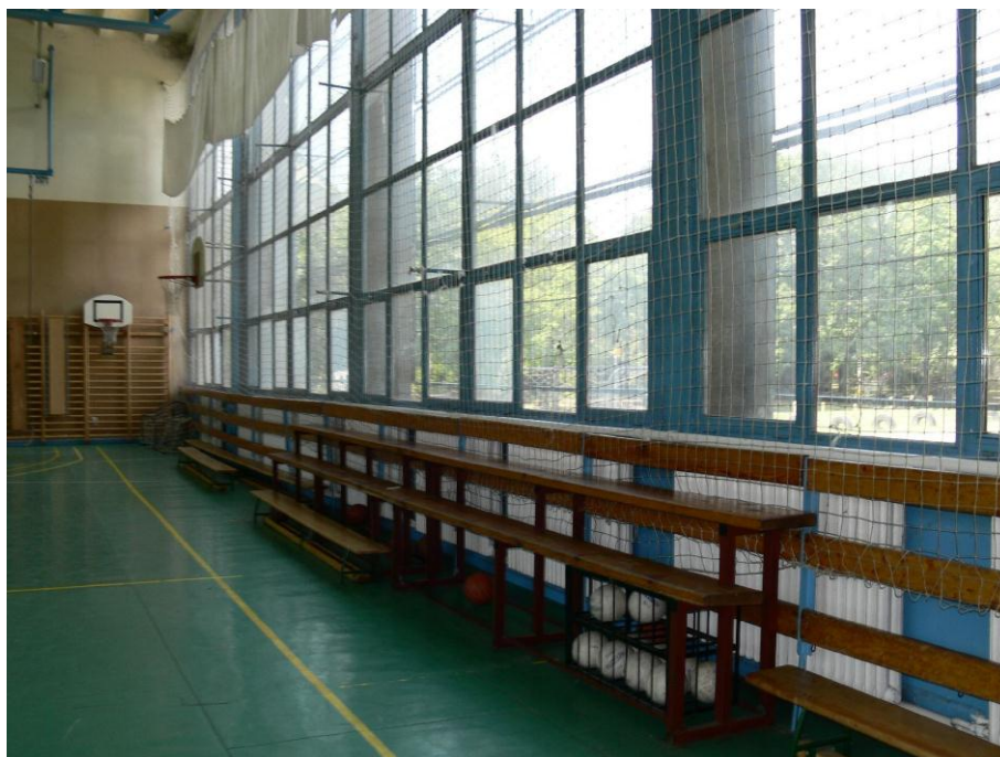
2. kép: tornaterem