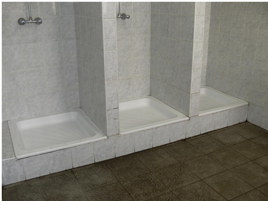
7. kép: zuhanyzó