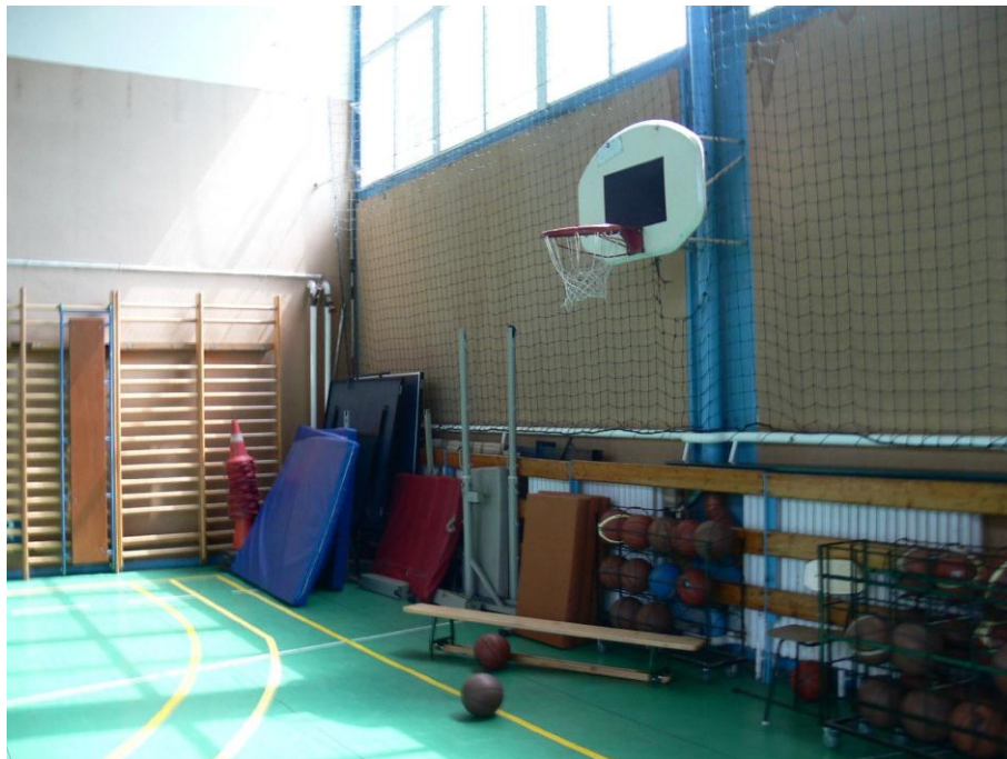
3. kép: tornaterem