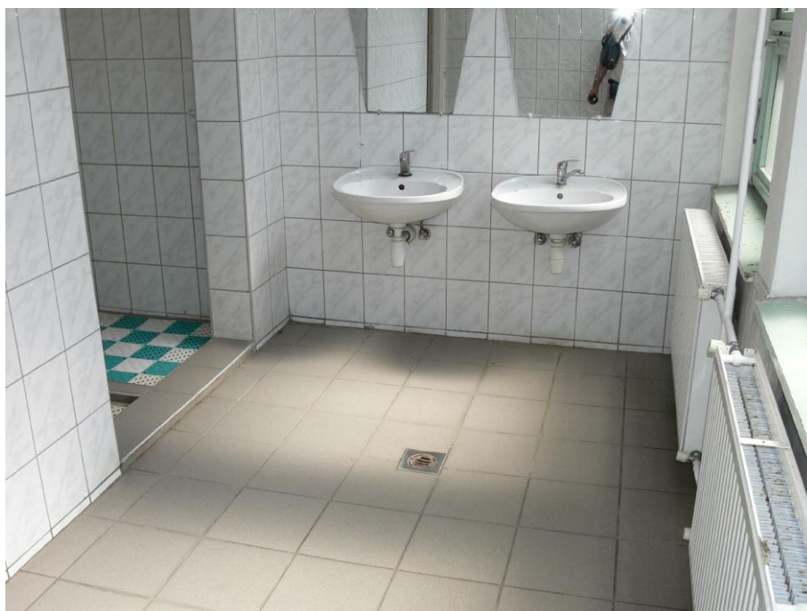
4. kép: zuhanyzó