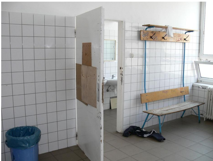
6. kép: öltöző