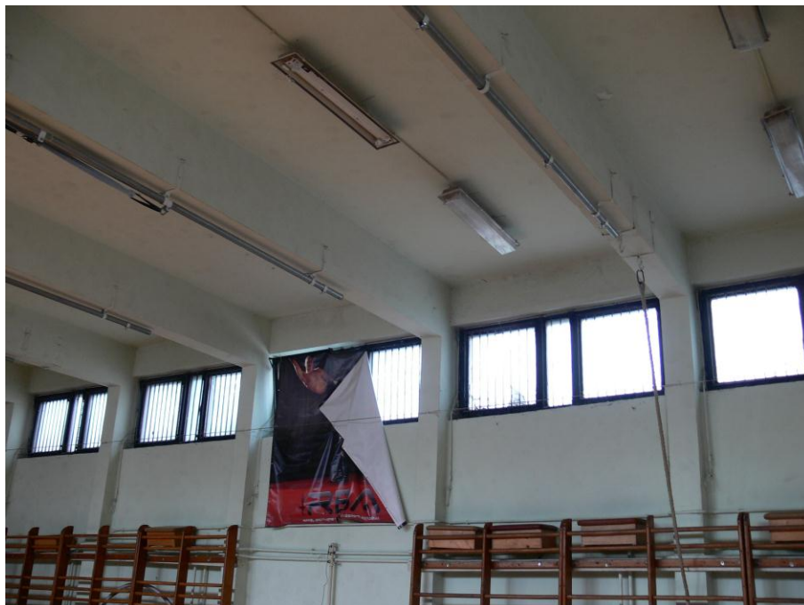
3. kép: tornaterem