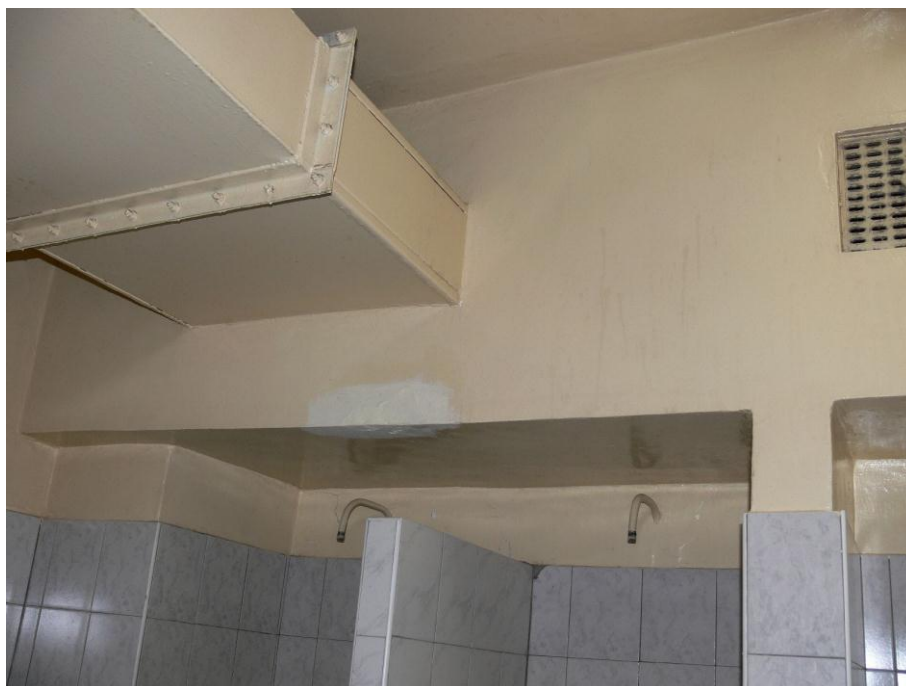
2. kép: zuhany