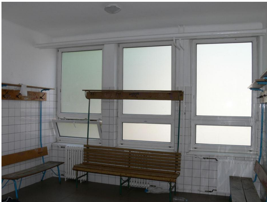
5. kép: öltöző