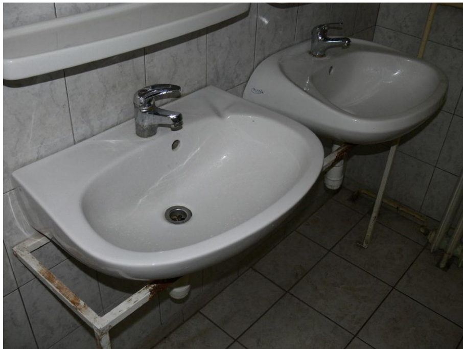
3. kép: mosdók