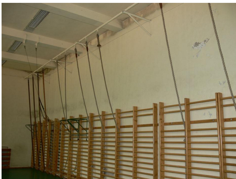
2. kép: tornaterem