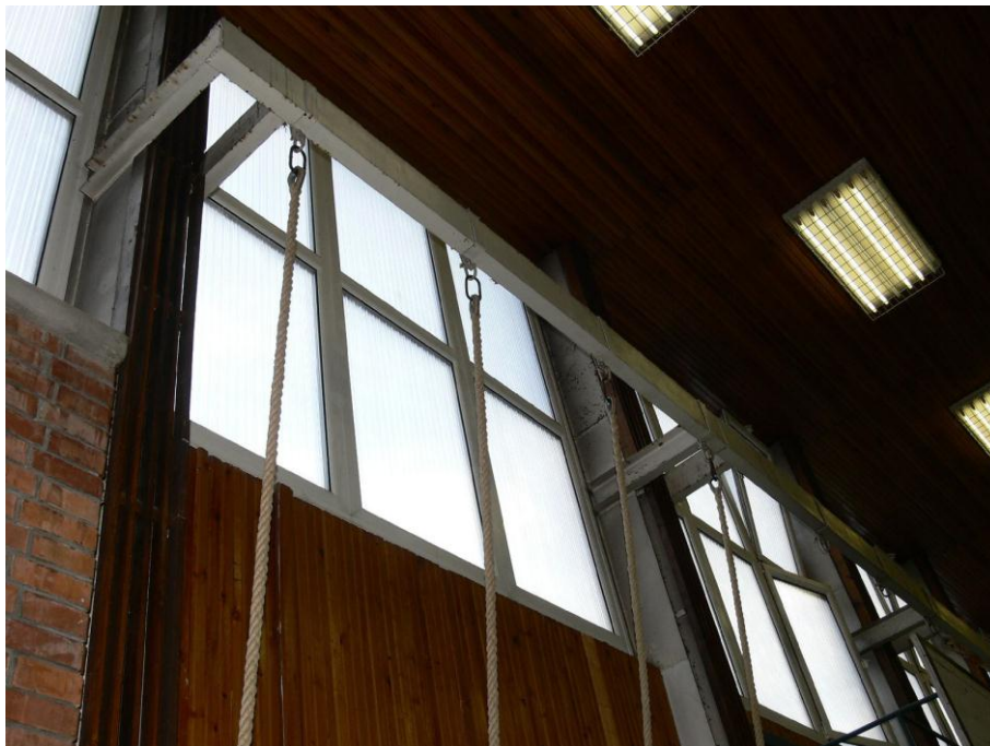
7. kép: tornaterem