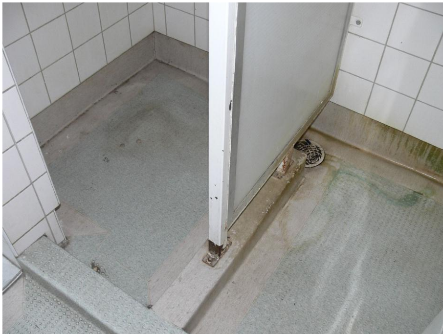
5. kép: zuhanyzó