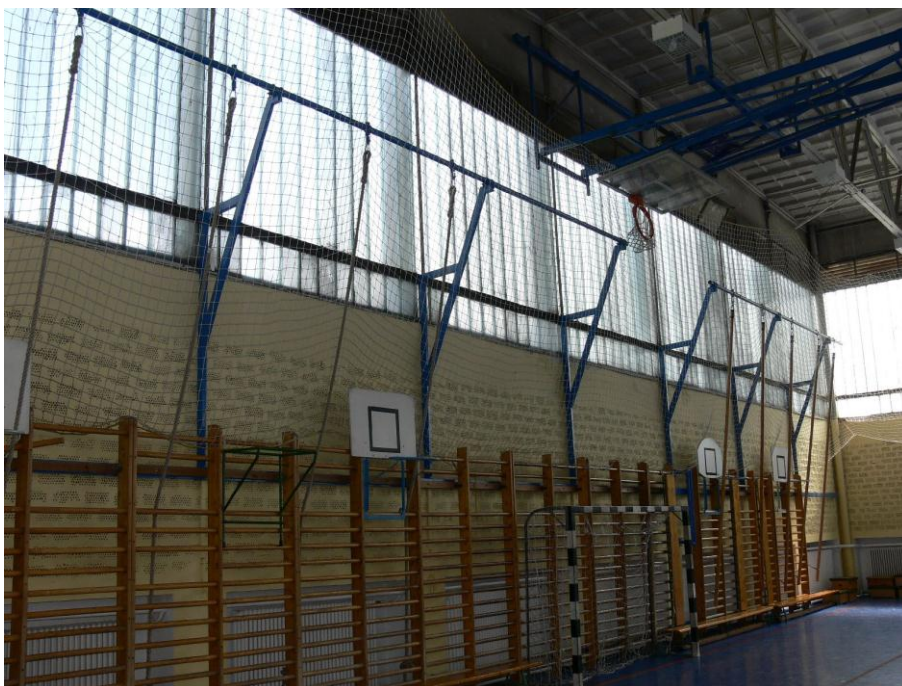
2. kép: tornaterem