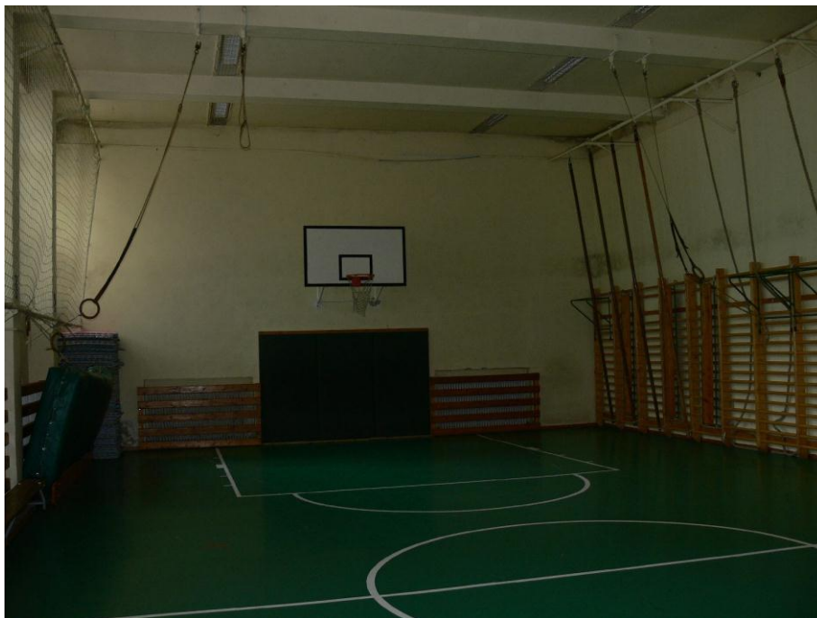
1. kép: a tornaterem