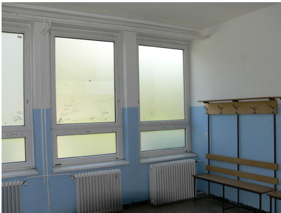
4. kép: lány öltöző