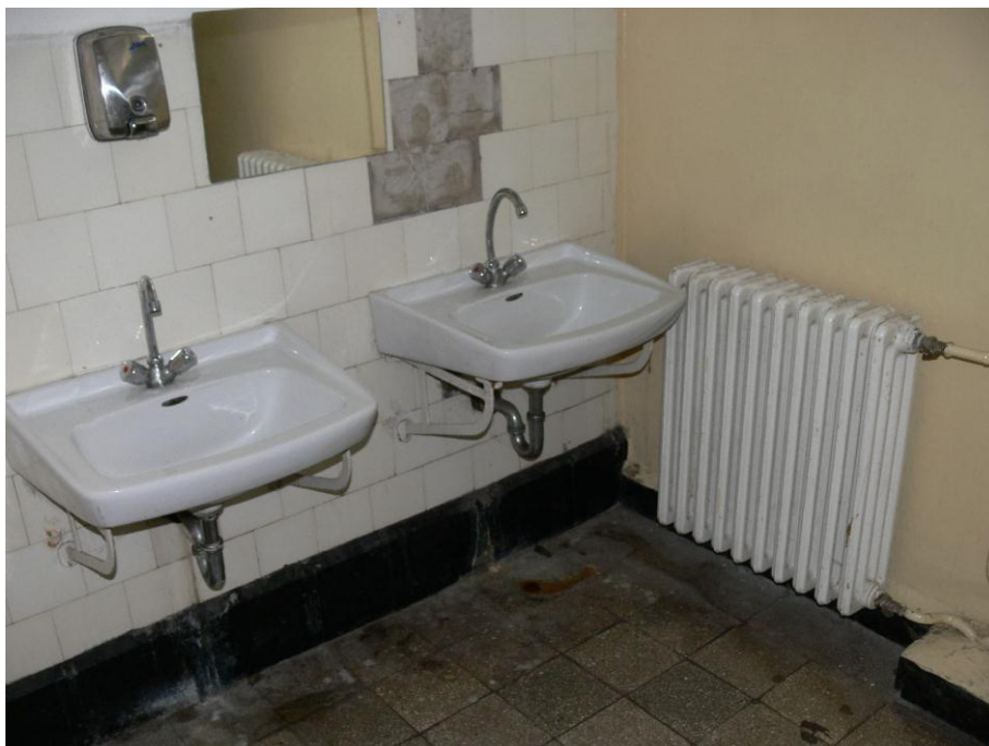
5. kép: mosdó