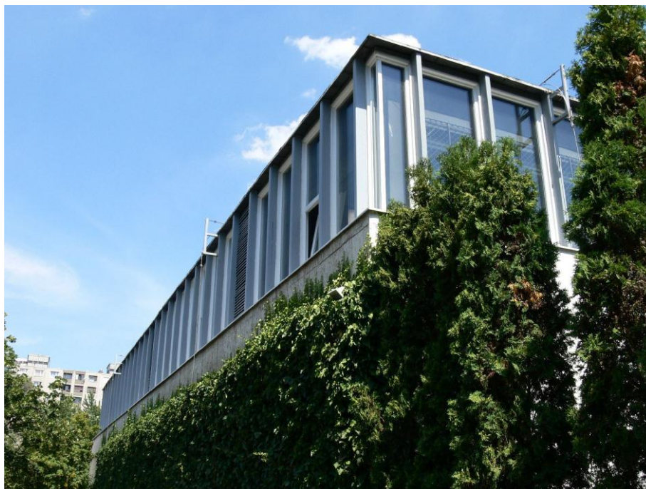
6. kép: homlokzat