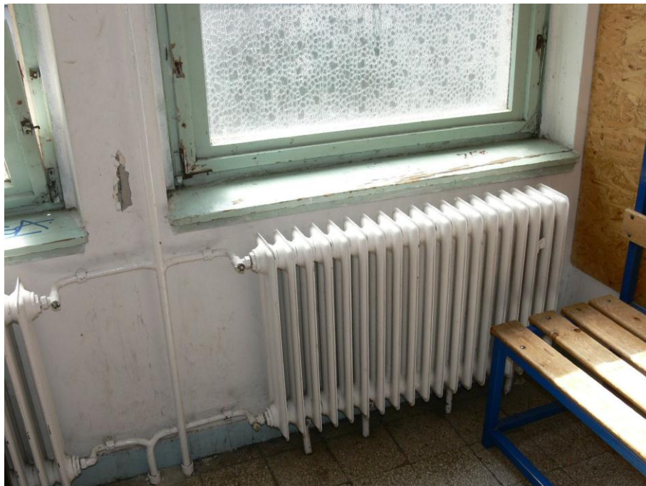
3. kép: fiú öltöző