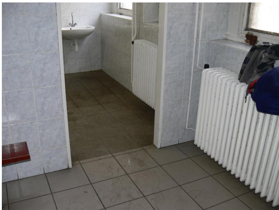
8. kép: öltöző