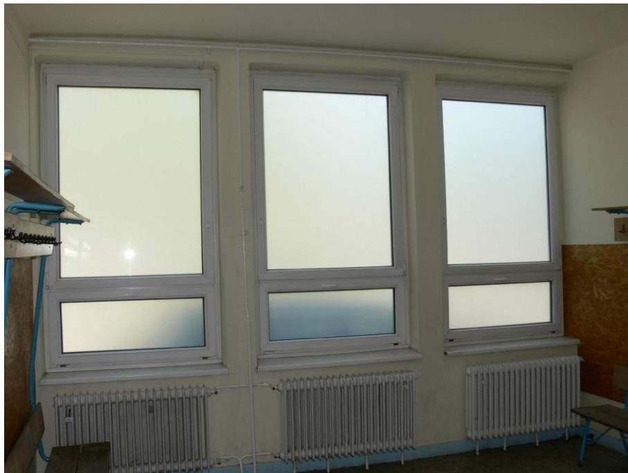
5. kép: lány öltöző