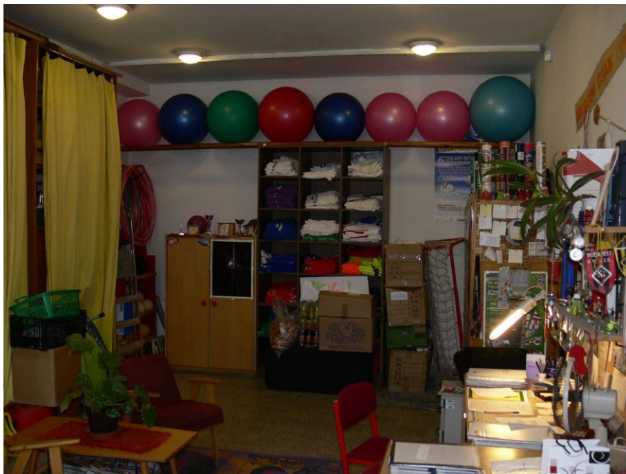
5. kép: tanári öltöző