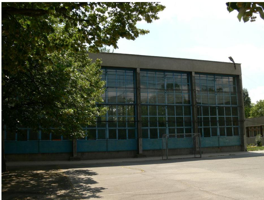
8. kép: homlokzat