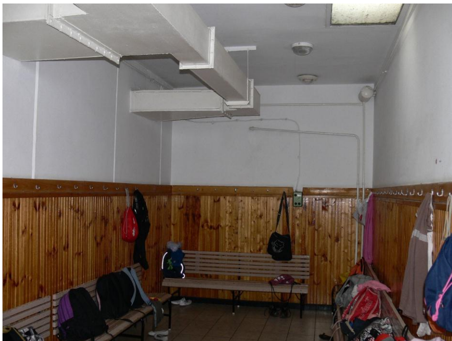
4. kép: öltöző