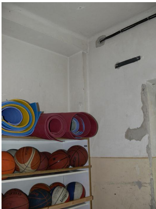
4. kép: szertár