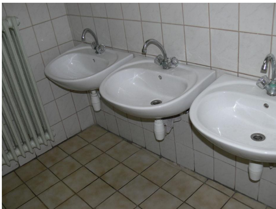
6. kép: mosdó