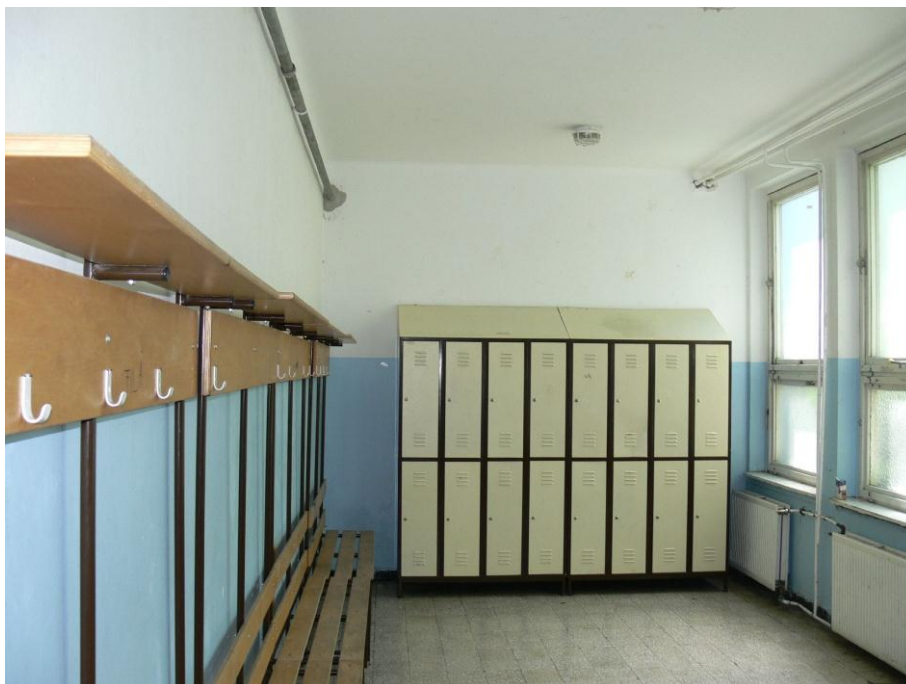
6. kép: fiú öltöző