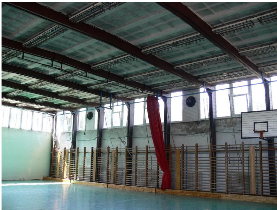
1. kép: a tornaterem