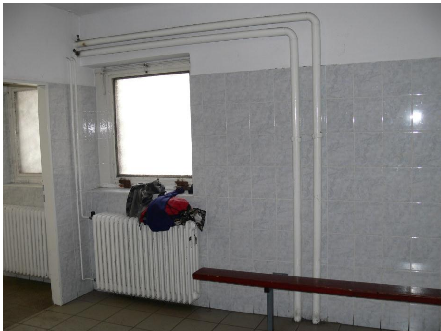
5. kép: öltöző