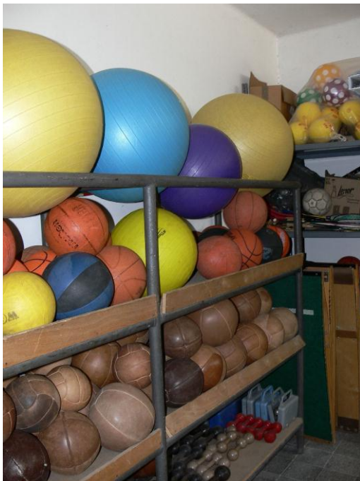
3. kép: szertár