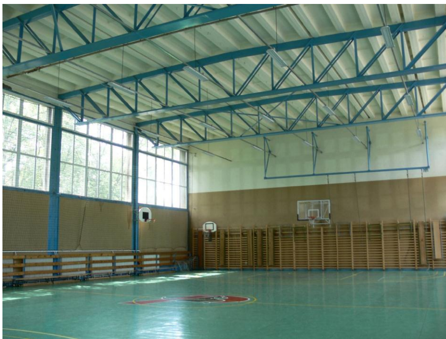
1. kép: tornaterem