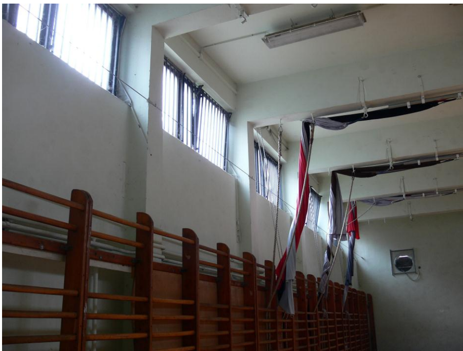
2. kép: tornaterem