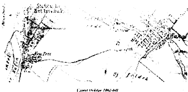
Újpest térképe 1862-ből. Jól látható a Palotai erdő és a vendéglő /Parkvendéglő/ elhelyezkedése

A Parkvendéglőnek mára nyoma sincs. Helyének meghatározása is nehéz. A Rákospalotai Múzeum 2008-ban kiadott könyvecskéje ‘Város születik’ így ír: "... a vasút megnyitása /1846/ után ... 1872-ben Rákospalotáig meghosszabbítják a néhány évvel korábban a Kálvin tértől Újpestig indított lóvasútvonalat.. a vasútállomás tövében kezdődő erdő, valamint a vasúti vendéglő ásványvizet adó kútja olyan vonzerőt jelentettek, ami a fővárosiak tömeges kiáramlását eredményezte." A kiadvány közli a Parkvendéglőről készült talán egyetlen megmaradt képeslapot, anélkül, hogy a könyv pontosan meghatározná annak helyét.