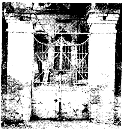
A hajdanán oly hívogató kapu talán nem marad majd örökké zárva